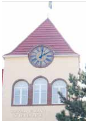
Referat Spraw Obronnych i Zarządzania Kryzysowego