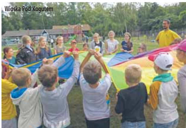
Wioska Pod Kogutem