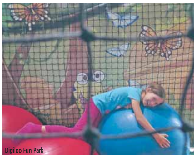
Digiloo Fun Park