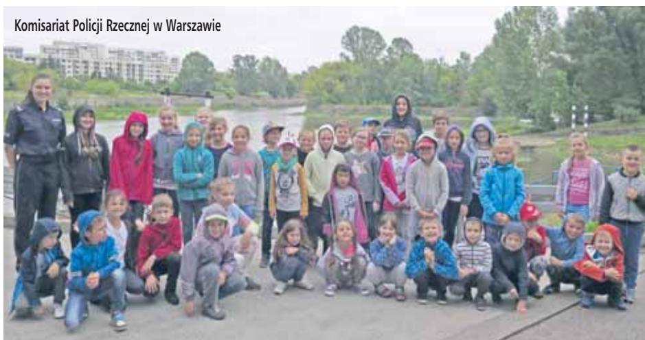
Komisariat Policji Rzeczej w Warszawie