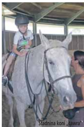
Stadnina koni „Ławra”