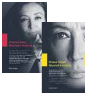
„Wywiad z historią” | „Wywiad z władzą”, Oriana Fallaci, Wyd. Świat Książki 2016 (zbiory wywiadów – reedycja | Biblioteka Publiczna w Wieliszewie)