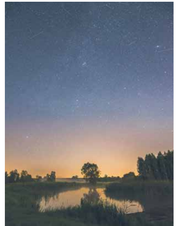
GWIAZDY NAD WIELISZEWEM W OBIEKTYWIE

Wydarzenie „Łapiemy spadające gwiazdy w Wieliszewie” odbyło się w nocy z 11 na 12 sierpnia br. Zostało zorganizowane spontanicznie przez mieszkańców Gminy Wieliszew. Pogoda dopisała jak i Perseidy, czyli spadające gwiazdy, które w ten wieczór staraliśmy się obserwować. W gronie kilkunastu osób i w otoczeniu Jeziora Wieliszewskiego mieliśmy niepowtarzalną okazję do oglądania pierwszego w tym roku maksimum tego roju meteorów.