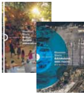
„Grecja. Gorzkie pomarańcze”, Wyd. W.A.B. 2013 | „Gdziekolwiek mnie rzucisz. Wyspa Man i Polacy. Historia splątania”, Wyd. W.A.B. 2015, Dionisos Sturis (reportaż literacki | Biblioteka Publiczna w Łajskach)

Po pełnych gorących książkowych premier wakacjach proponujemy Państwu chwilę wyciszenia przy tytułach, które co prawda pojawiły się w naszych bibliotekach niedawno, ale swoje premiery miały kilka miesięcy, kilkanaście czy nawet kilkadziesiąt lat temu. Warto czytać reedycje – szczególnie, jeśli ich nowe wydania zyskują nie tylko ładniejsze okładki, ale i zadziwiająco współczesny kontekst.