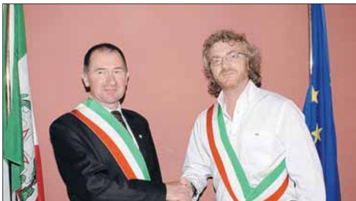
Przyjacielski uścisk dłoni