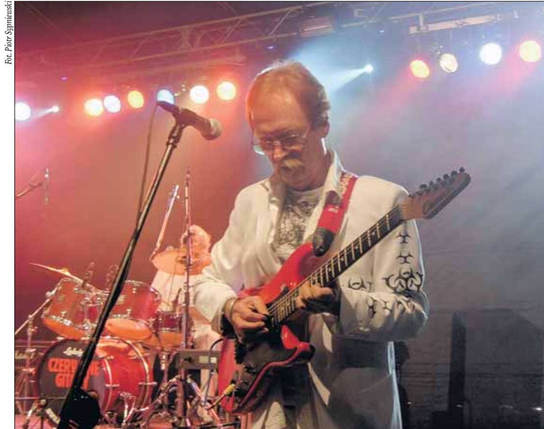
Jeden z założycieli Czerwonych Gitar, Jerzy Kosela