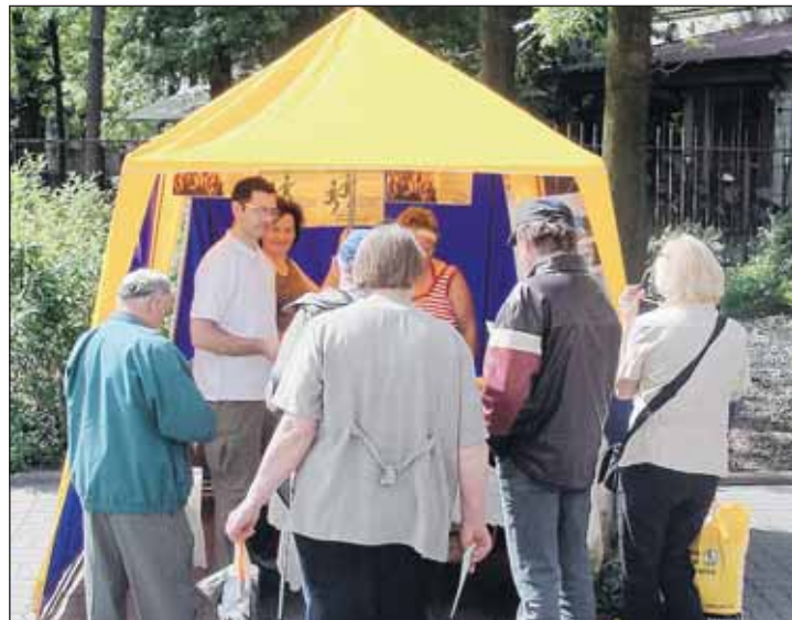
Stoisko Gminy Wieliszew i Stowarzyszenia „Woda i Las”

Festyn zorganizował J. E. Arcybiskup Sławoj Leszek Głódz z okazji 360. rocznicy nadania praw miejskich Pradze. Do udziału w jarmarku zostały zaproszone tylko wybrane miasta i gminy wchodzące w skład diecezji warszawsko-praskiej.