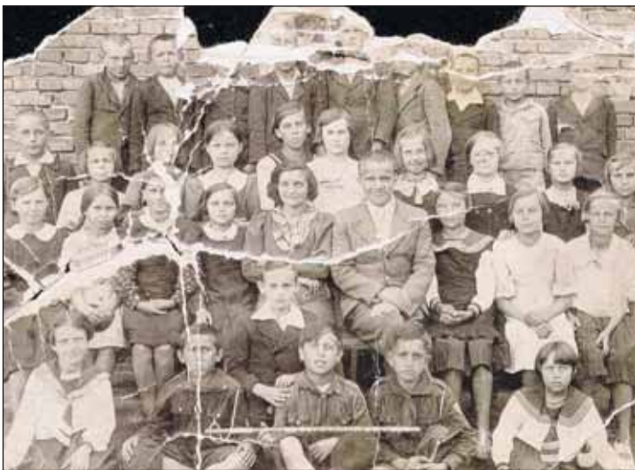
Nauczyciele i uczniowie szkoły wieliszewskiej