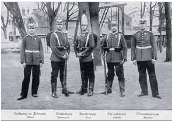
Żołnierze niemieccy w pełnym umundurowaniu