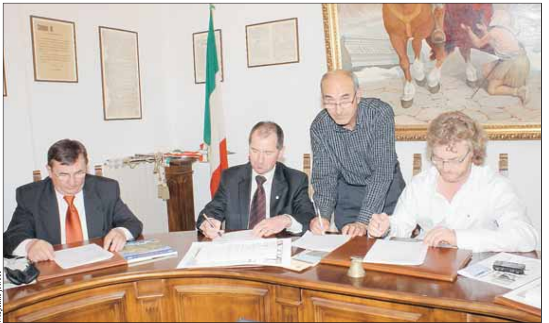
Uroczyste podpisanie umowy partnerskiej

Gmina Wieliszew, podobnie jak pozostałe samorządy w powiecie, rozwija swoje kontakty międzynarodowe. Jak już wspominaliśmy na początku roku, Rada Gminy Wieliszew podjęła uchwałę o wyrażeniu woli zawarcia porozumienia z włoską Gminą Graffignano.