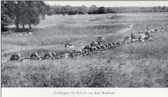
Manewry armii niemieckiej