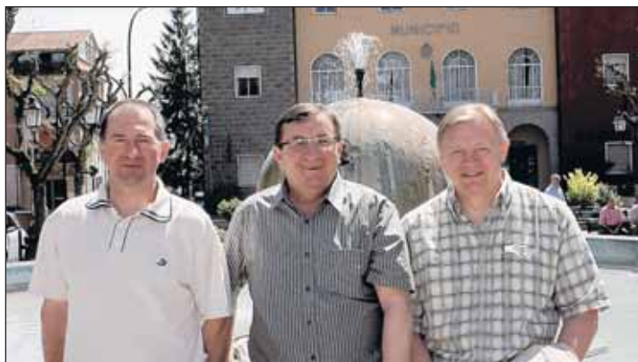
Przedstawiciele Gminy Wieliszew przed ratuszem Graffignano

Stosunkowo nisko położona względem poziomu morza oraz sąsiadująca z doliną jednej z głównych rzek Włoch Tybrem i najsłynniejszą włoską drogą Autostradą Słońca. Obszar gminy