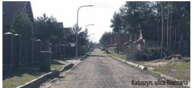
Katuszyn, ulica Rodzina