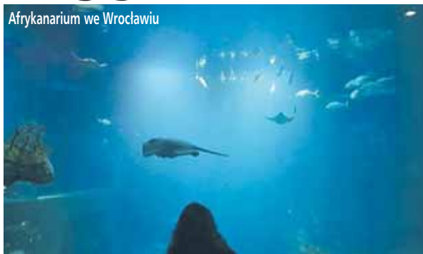
Afrykanarium we Wrocławiu

W drugim tygodniu ferii uczestniczyliśmy w Zimowym Parafialnym Wyjeździe Rodzin do Jeleniej Góry zorganizowanym przez Parafię Przemienienia Pańskiego w Wieliszewie.