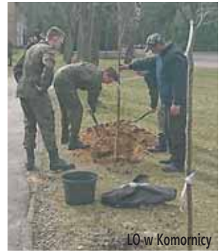
LO w Komornicy