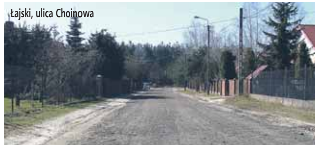
Łajski, ulica Chojnowa