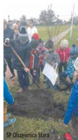
SP Olszewnica Stara