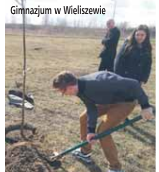
Gimnazjum w Wieliszewie