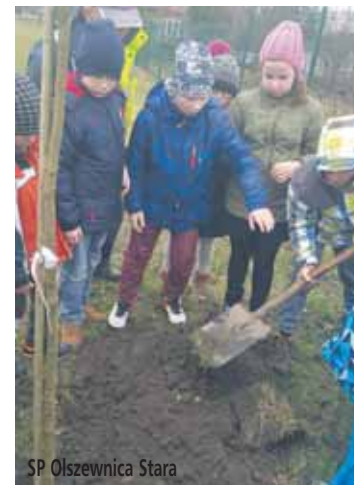
SP Olszewnica Stara