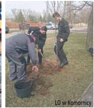
LO w Komornicy