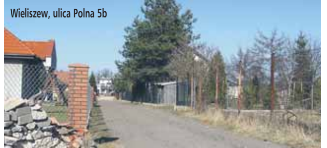
Wieliszew, ulica Polna 5b