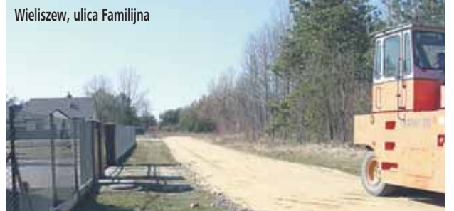
Wieliszew, ulica Familijna