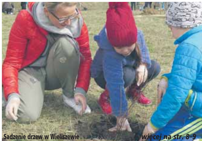
Sadzenie drzew w Wieliszewie

Tradycją już jest, że w Gminie Wieliszew organizowane jest coroczne sprzątanie świata. W tym roku było to wyjątkowe wydarzenie, bo wzbogaciła je akcja „Sadzenia drzew w Gminie Wieliszew”.