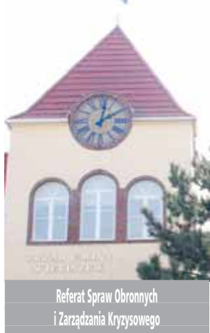
Referat Spraw Obronnych i Zarządzania Kryzysowego