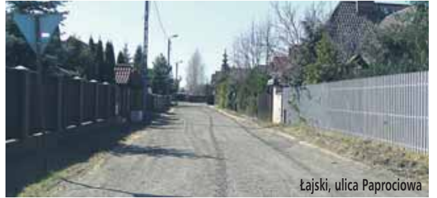
Łajski, ulica Paprociowa