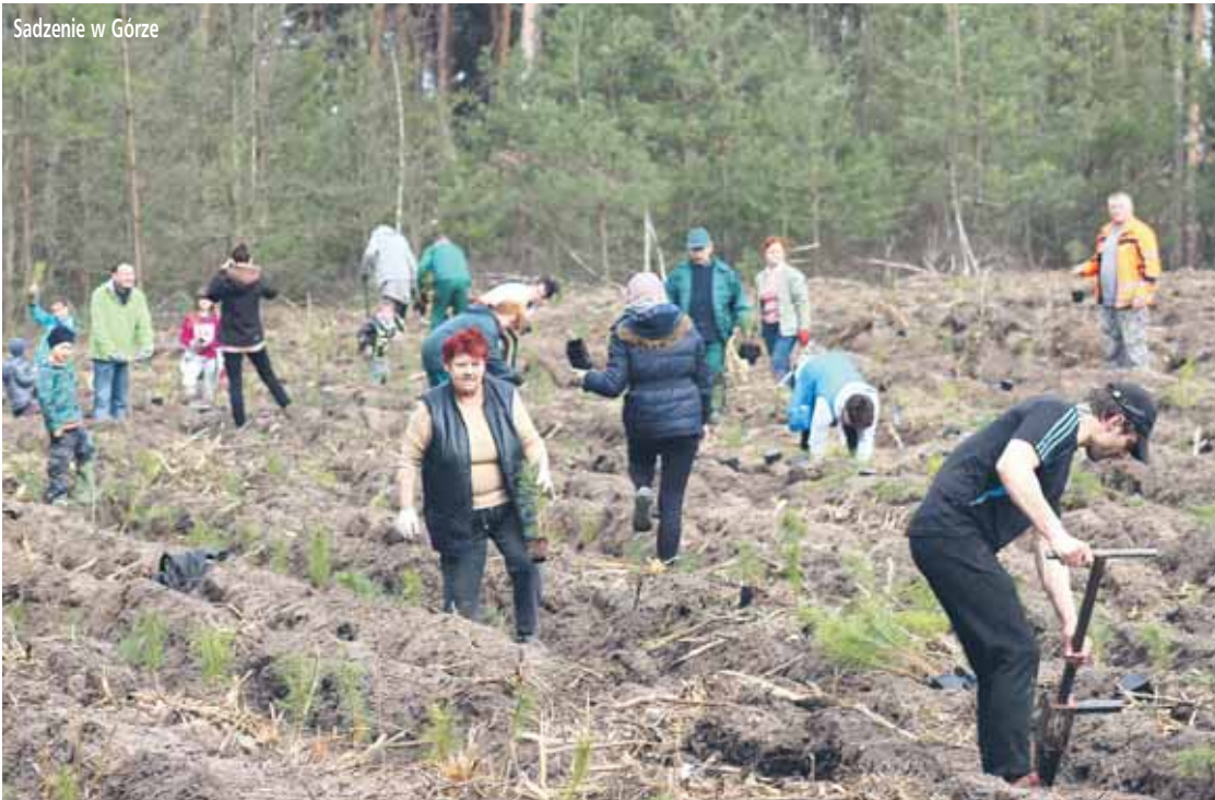
Sadzenie w Górze