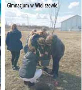
Gimnazjum w Wieliszewie