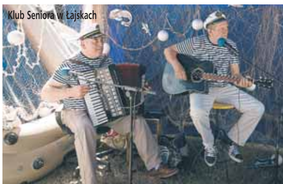
Klub Seniora w Łąjskach