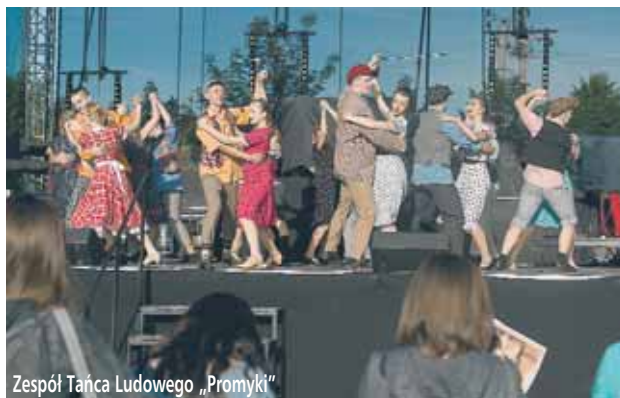
Zespół Tańca Ludowego „Promyki”