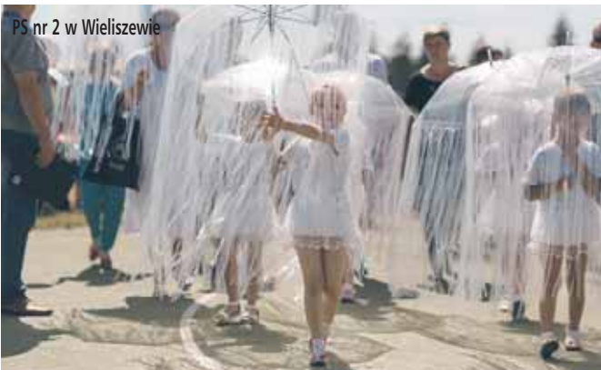
PS nr 2 w Wieliszewie