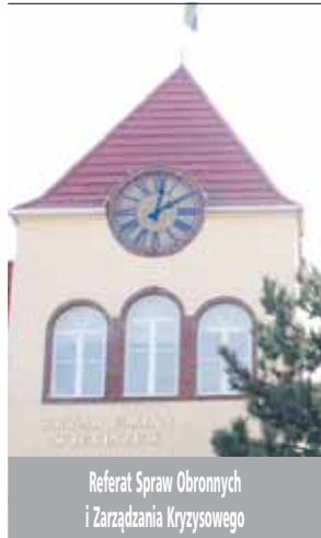
Referat Spraw Obronnych i Zarządzania Kryzysowego