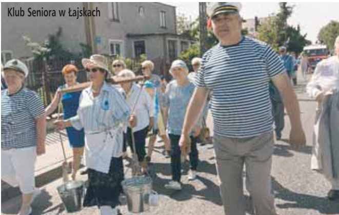
Klub Seniora w Łąjskach