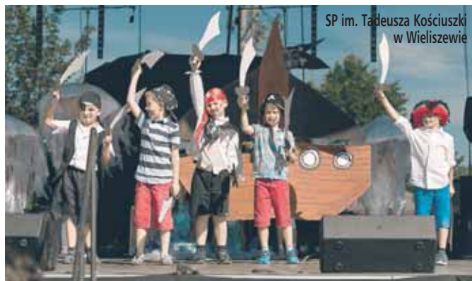
SP im. Tadeusza Kościuszki w Wieliszewie