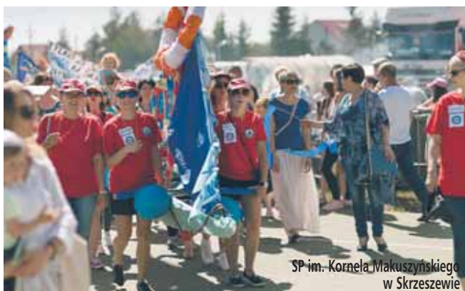
SP im. Kornela Makuszyńskiego w Skrzeszewie