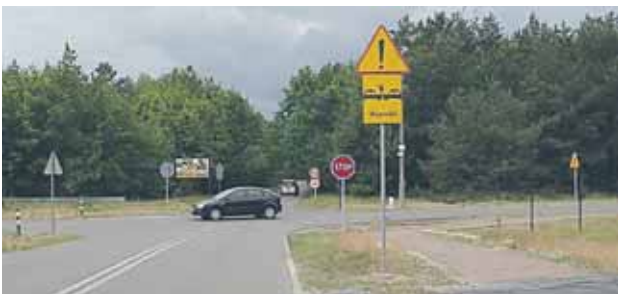
POPRAWA BEZPIECZEŃSTWA NA SKRZYŻOWANIU UL. PRZEDPEŁSKIEGO I WSPÓLNEJ W WIELISZEWIE