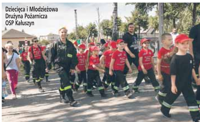
Dzieci i Młodzieżowa Drużyna Pożarnicza OSP Kałuszyn