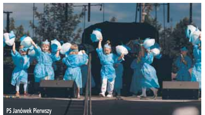
PS Janówek Pierwszy