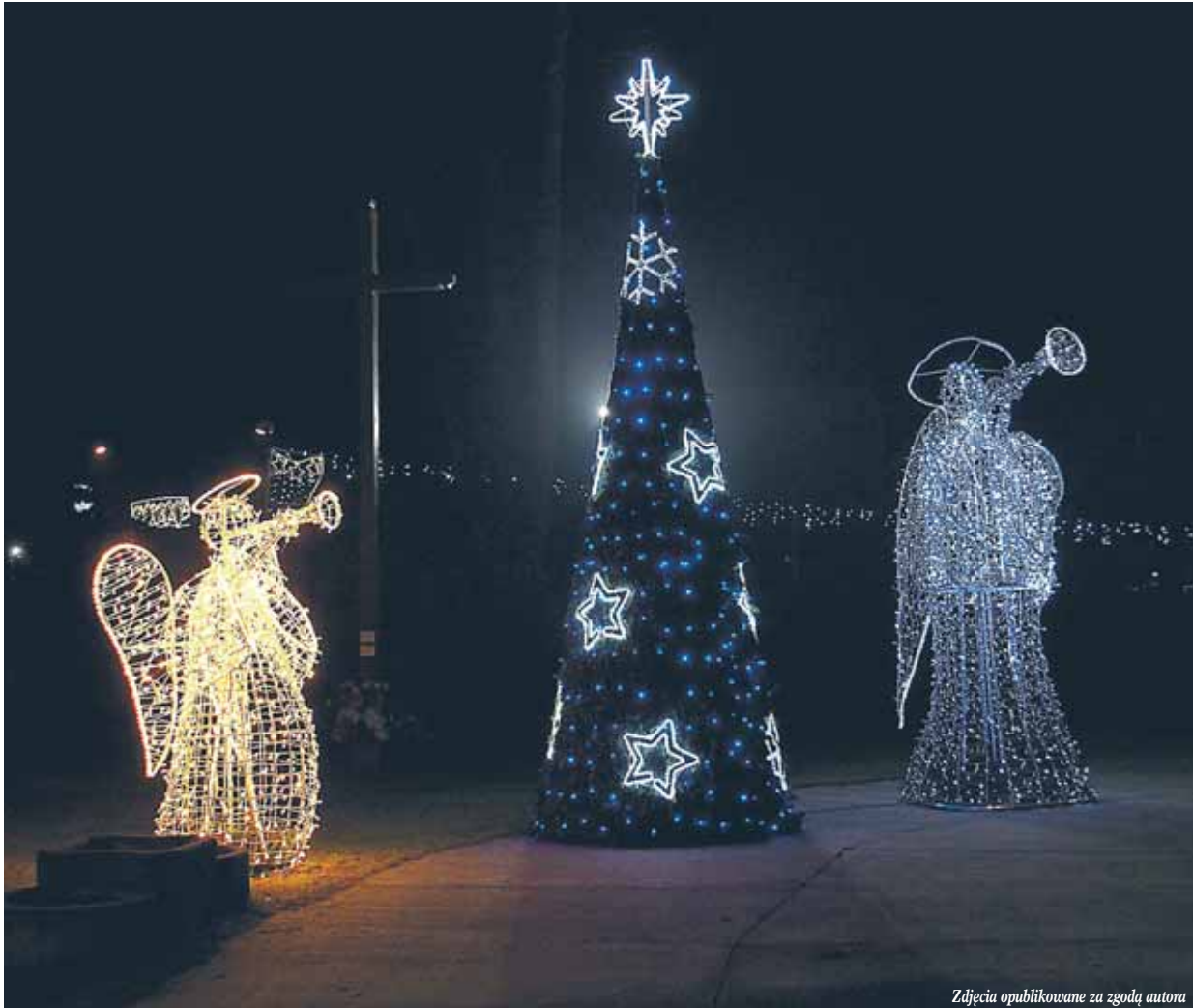
Zdjęcia opublikowane za zgodą autora