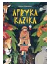
„Afryka Kazika” Łukasz Wierzbicki Wyd. BIS 2017 – wyd. 3 S | dla dzieci