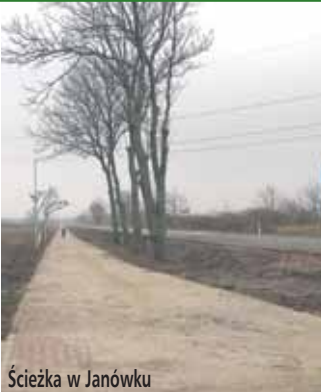
Ścieżka w Janówku

W trosce o środowisko na terenie całej Gminy powstają nowe ścieżki rowerowe. Głównym celem było doprowadzenie do sytuacji, w której będzie można przejechać rowerem przez całą Gminę. W tym roku do państwa dyspozycji zostały przekazane między innymi ścieżki: