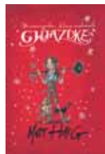
„Dziewczynka, która uratowała gwiazdkę” Matt Haig Wyd. Zysk i S-ka 2017 W | dla dzieci