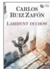
„Labirynt duchów” Carlos Ruiz Zafon Wyd. Muza 2017 M-R | powieść hist.-spol.-obycz.