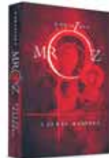
„Czarna Madonna” Remigiusz Mróz Wyd. Czwarta Strona 2017 M-R, W | thriller-krym.-sens.