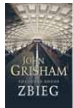
„Theodore Boone. Zbieg” John Grisham Wyd. Albatros 2017 M-R | dla młodzieży