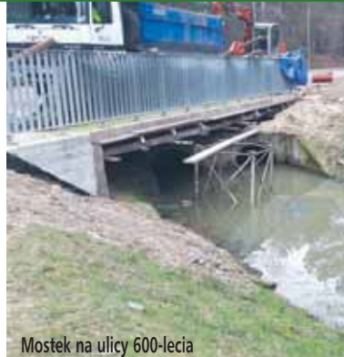
Mostek na ulicy 600-lecia