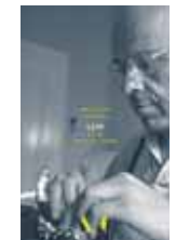
„Lem. Życie nie z tej Ziemi” Wojciech Orliński Wyd. Czarne 2017 W | biograf.