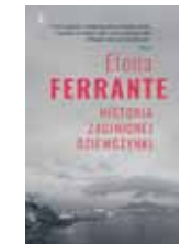
„Historia zaginionej dziewczynki” oraz pozostałe 3 tomy cyklu neapolitańskiego Elena Ferrante Wyd. Sonia Draga 2017 M-R | powieść spol.-obycz.