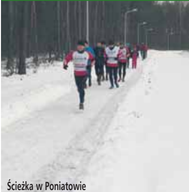
Ścieżka w Poniatowie