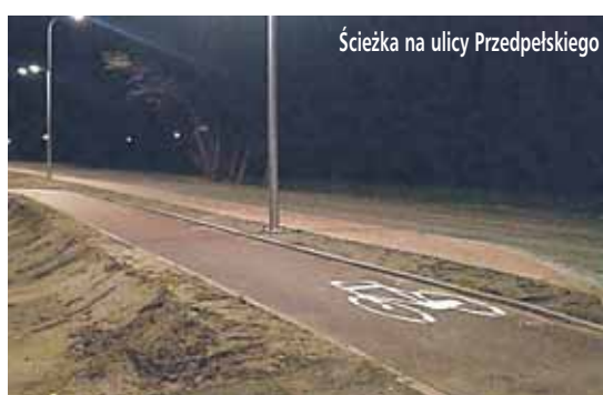
Ścieżka na ulicy Przedpełskiego

Dworem Mazowieckim (projekt finansowany zarówno z Urzędu Marszałkowskiego Województwa Mazowieckiego oraz Gminy Wieliszew w kwocie 1 300 000 zł), – ścieżka łącząca ronda została oddana do użytku w styczniu tego roku – łączy obydwie ronda w tzw. Poniatowie.