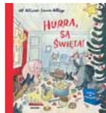
„Hurra, są Święta!” Ulf Nilsson, Emma Adbage Wyd. Zakamarki 2017 W | dla dzieci