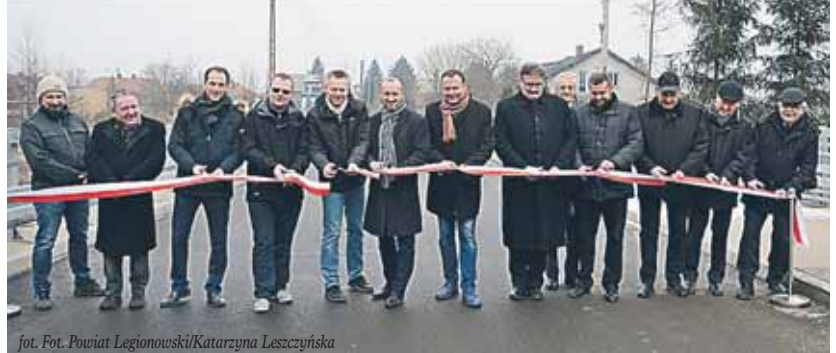
fol. Fot. Powiat Legionowski/Katarzyna Leszczyńska