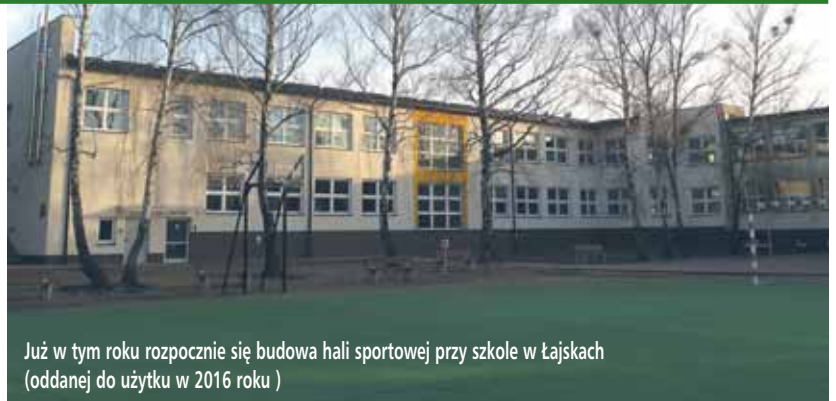
Już w tym roku rozpocznie się budowa hali sportowej przy szkole w Łajskach (oddanej do użytku w 2016 roku)

Po pomyślnym zakończeniu prac projektowych i otrzymaniu pozwolenia na budowę, zostanie ogłoszony przetarg i wybrany wykonawca. Prace, zgodnie z przyjętym przez Radę Gminy Wieliszew budżetem, rozpoczną się w 2018 roku.