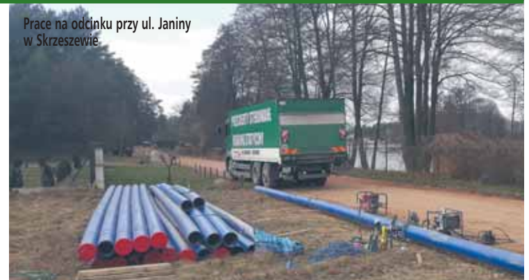
Prace na odcinku przy ul. Janiny w Skrzyszewie

Wraz z poprawą pogody na dobre ruszyły prace przy wodociągowaniu gminy. Dotychczas dostęp do wody, a przede wszystkim wody dobrej jakości, był bardzo utrudniony. Wyhodując naprzeciwko oczekiwaniom mieszkańców i działkowców, gmina w sposób priorytetowy potraktowała tę inwestycję i zdecydowała się na jej jak najszybszą realizację. Wraz z trwaniem prac, wzrasta zainteresowanie mieszkańców podłączeniem się do sieci wodociągowej – dlatego przypominamy, że wnioski o podłączenie składać można na biuro obsługi klienta w urzędzie gminy.