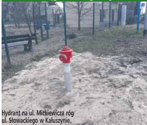
Hydrant na ul. Mickiewicza róg ul. Słowackiego w Kałuszynie