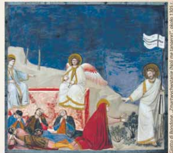
Giotto di Bondone, „Zmartwychwstanie (Noś me tangere)”, około 1305 r.