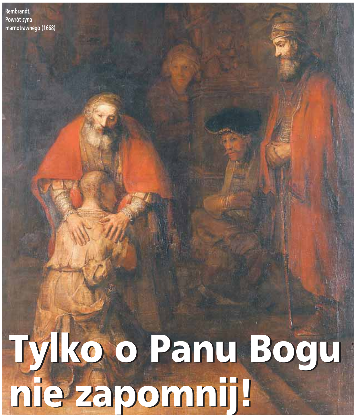
Rembrandt, Powrót syna marnotrawnego (1668)