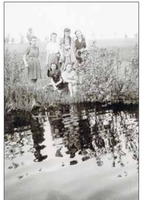
Lipiec 1944 roku