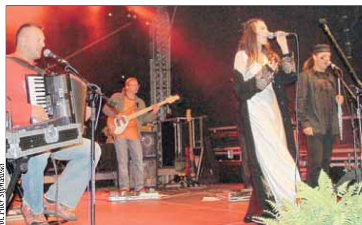
Występ zespołu „Brathanki”

Z godziny na godzinę publiczności przybywało – a to za sprawą gwiazdy wieczoru, która