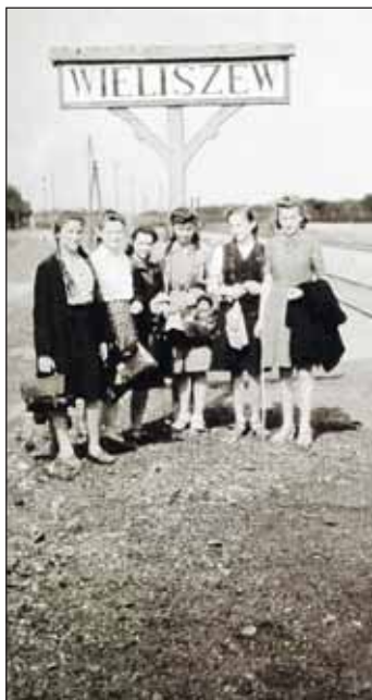
Zastęp Sosny, drużyna Legonowo 1943 roku