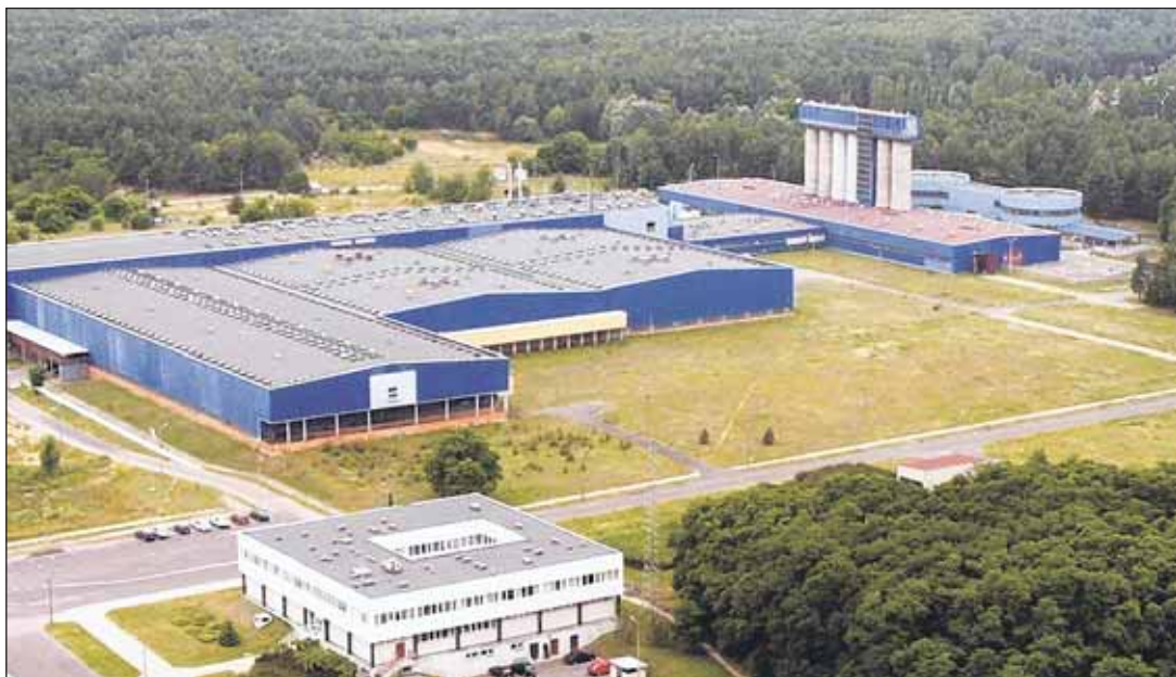
Istniejąca zabudowa – Zakład Wodociągów Północnego