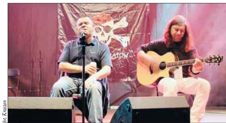
Show przygotowany przez uczestników Workcampu