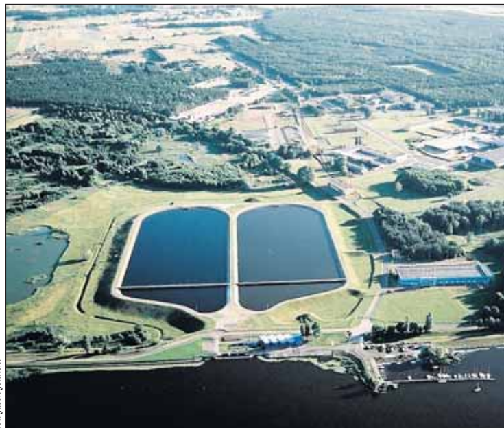
Teren Zakładu Wodociągów Północnego w Wieliszewie