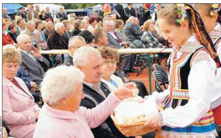
„Promyki” częstują dożynkowy chlebem

ściowym programie. Po raz kolejny słycać było głosy widzów, że poziom artystyczny oraz technika zespołu z występu na występ są coraz lepsze. Obok naszego popularnego zespołu „Promyki” na sce-