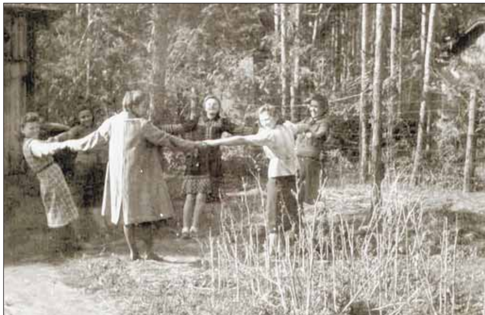
Wieliszew 1944 roku