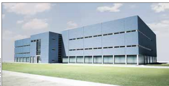
Budynek Stacji Flotacji Ciśnieniowej – wizualizacja

Faza II Projektu koncentruje się na poprawie jakości wody i niezawodności systemu jej rozprowadzania. Ten etap zakłada dwie wielkie inwestycje: modernizację w Stacji Uzdatniania Wody Zakładu Wodociągów Centralnego (wprowadzenie procesu ozonowania pośredniego i filtracji na węglu aktywnym) oraz Wodo-