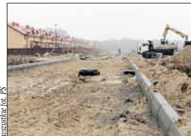
Aleja Solidarności w Wieliszewie

We wsi Michałów-Reginów udało się rozwiązać problem z oświetleniem w miejscach szczególnie ważnych dla mieszkańców. Są to ulice: Akacjowa, Wczasowa, Główna i Długa. Również w Michałowie-Regino-