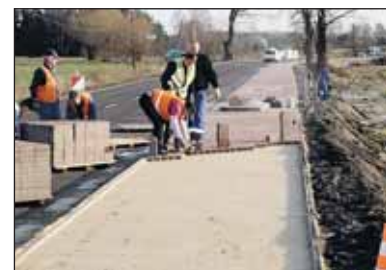
Chodnik w Olszewnicy Starej – wspólna inwestycja Gminy i Powiatu

wie została ulepszona nawierzchnia ulicy Prostej, która momentami była nieprzejezdna. Na razie jest ona wyziwiona, ale docelowo zostanie wyasfaltowana i podłączona do sieci sanitarnej. Również na ul. Długiej, na odcinku od torów kolejowych do tartaku, zostanie poprawiona nakładka asfaltowa.