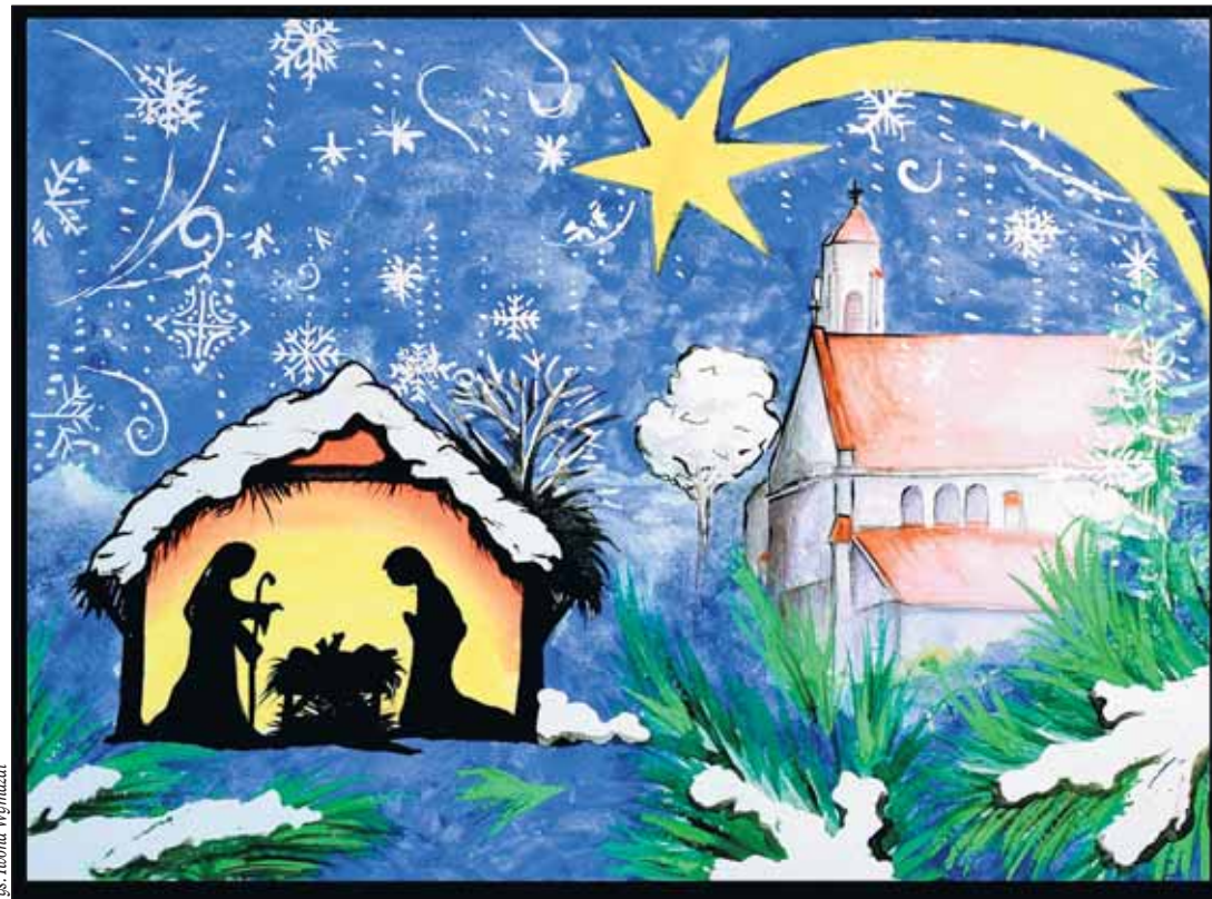
rys. Iwona Wymazal

Oczywiście Boże Narodzenie to piękny, szczególny czas zasługujący na wyjątkową oprawę. Nie chodzi również o to, by rezygnować z przyjemności obdarowywania bliskich. Ale może czasem warto zastąpić drogie prezenty skromniejszym upominkiem, a w zamian ofiarować własny uśmiech i życzliwość tym wszyst-