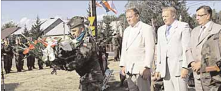
Delegacja Gminy składa kwiaty pod pomnikiem w Olszewnicy Starej

Ostatnie miesiące nie szczędziły okazji do oddania hołdu żołnierzom i osobom cywilnym, które walczyły o wolność Ojczyzny oraz uczczenia ofiar wojen.