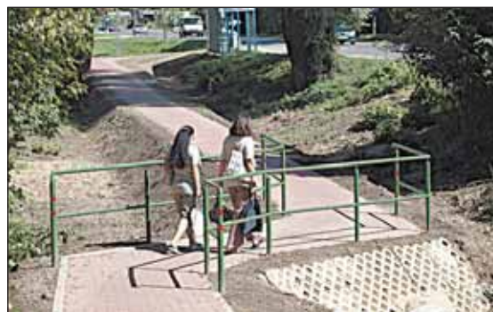
Z kładki już korzystają mieszkańcy

Nurtującą od dawna sprawą była budowa kładki nad Kanałem Bródnowskim w Michałowie-Reginowie. O tę inwestycję od lat pytali mieszkańcy, którzy musieli pokonywać odcinek ruchliwej drogi krajowej nr 61 wąskim mostkiem, nieprzystosowanym dla pieszych i rowerzystów. Na szczególne niebezpieczeństwo narażone były dzieci z Michałowa-Reginowa, które w drodze do Szkoły Nr 8 w Legionowie musiały przeciskać się przy jezdni, gdzie często dochodziło do tragicznych wypadków.