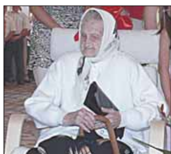
Jubilatka na fotelu – prezencie od mieszkańców Gminy

„Samorząd Gminy Wieliszew składa Pani serdeczne gratulacje z okazji obchodzonej 3 sierpnia 2009 roku 100. rocznicy urodzin. Jest Pani najstarszą mieszkanką naszej Gminy. W ciągu całego swojego życia była Pani świadkiem historycznych zdarzeń, jakie były udziałem naszej ojczyzny. Od ostatnich lat pod zaborami, poprzez I wojnę światową, odzyskanie niepodległości, dwudziestolecie międzywojenne, II wojnę światową, okres PRL i wreszcie odzyskanie suwerenności i wejście w struktury Unii Europejskiej. To całe epoki i już niewielu ludzi może poszczycić się tak dużym życiowym doświadczeniem oraz tak liczną rodziną, dochowując się 7 dzieci, 15 wnuków, 30 prawnuków i 3 praprawnuków. Pozostajemy pełni podziwu dla Pani długiego i jakże owocnego życia. W dniu jakże symbolicznym składamy życzenia 200 lat życia w zdrowiu i sa-