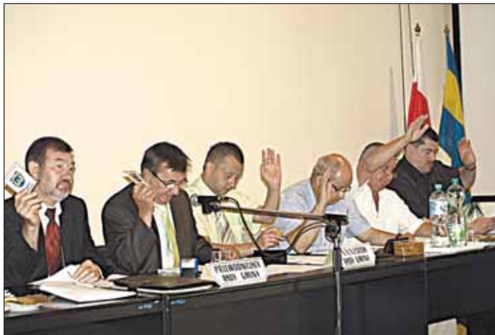
Pierwsze głosowanie po wakacjach