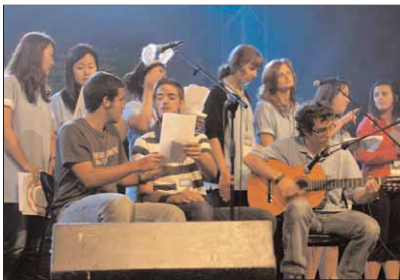
Workcamp ujawnia talent wokalny

Imprezę poprowadził Tomek Leonard. Zorganizowali ją: Ośrodek Kultury w Wieliszewie, Referat Informacji i Promocji UG Wieliszew, Stowarzyszenie „Młodzi dla Rozwoju eMka”, Starostwo Powiatu Legionowskiego. Partnerami byli: Gniazdo Piratów, Szanty24.pl, FolkowaArt.pl oraz Królewskie.