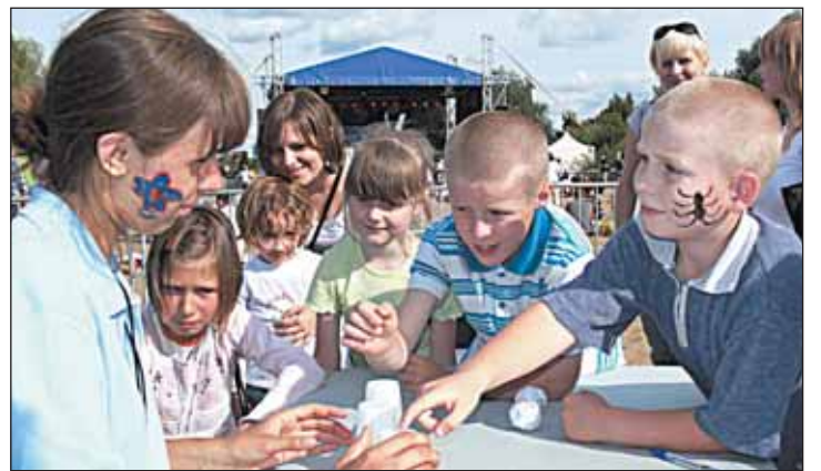
Inga z Litwy uwielbia konkursy. Wieliszewskie dzieci też...

Jak co roku do Wieliszewa przybyli młodzi, ekologicznie usposobieni wolontariusze z całego świata, by w ramach tradycyjnego workcampu wspomóc Gminę Wieliszew w porządkowaniu terenów nad Zalewem Zegrzyńskim.