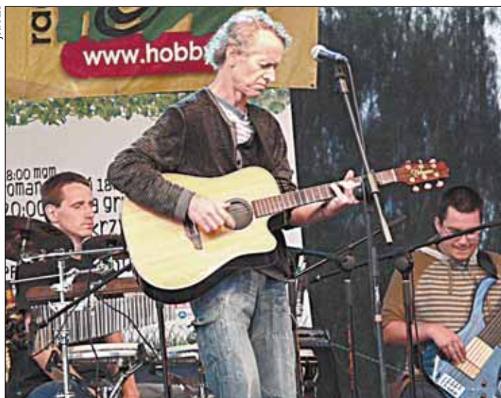
Wolna Grupa Bukowina