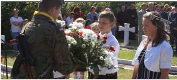
Uroczystości z okazji wybuchu II wojny światowej w Wieliszewie