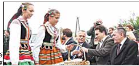
Dożynkowym chlebem czcują młodzież z zespołu „Promyki”