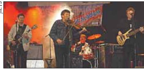
Skaldowie w pełnym składzie