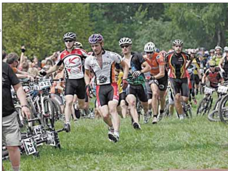
Start do wyścigu