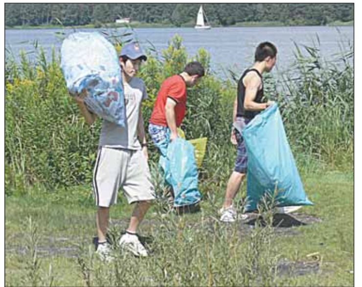
...i podczas pracy