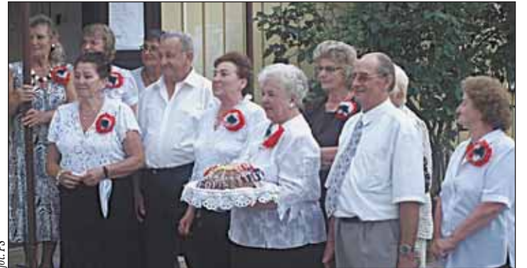
Delegacja społeczności Michałowa-Reginowa wita naszych włoskich przyjaciół

Jest chwila powitań, ale nadchodzi czas pożegnania. Ostatniego dnia nasi goście wybrali się ponownie do Warszawy, gdzie równocześnie na Zamku Królewskim pojawił się... Dalajlama, co oprócz zwiedzania samego Zamku stanowiło sporą atrakcję. Niektórzy sko-