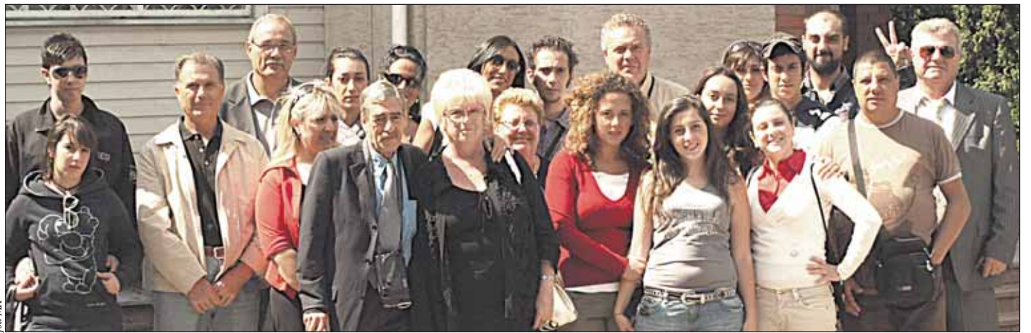
Włosi przyjaciele z Gminy Graffignano

Chwile zadumy i refleksji nadeszły w piątek. W tym dniu grupa udała się do Państwowego Muzeum Auschwitz-Birkenau. Podczas oglądania miejsca kaźni milionów niewinnych ludzi towarzyszyły ogromne emocje. Nie obyło się bez łez. Dla większości Włochów był to pierwszy kontakt z tym miejscem. Potem były Wadowice, gdzie goście zwiedzili Dom Papieski. We