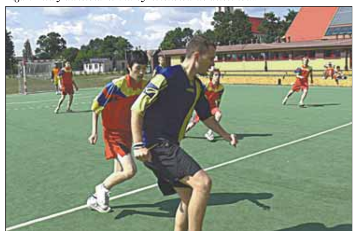
Zwycięski mecz międzynarodowej drużyny

Poza sprzątaniami w tym roku młodzież wspierała organizację