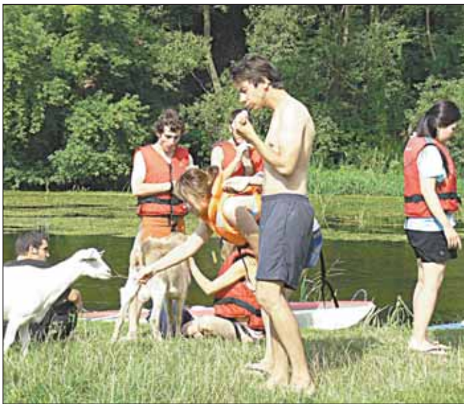
Workcamp na spływie kajakowym

I ten głos: Dołączyć, dołączyć! Prędeży!, Prędeży! Nie zostawać w tyle! Do Cove da Iria! Wcisnęłam kask i głowę Pod głąz wiatru trzaskający śmiechem, Przedemną wyrasta góra wysoka Jak gałąź za niską Wbijają się we mnie całym swoim zбочem Naprzęta muskuły, strąca mnie z siebie, Coraz mocniej spycha z siebie, Całym swoim ciężarem zapada się w przestrzeń serca, W żyłach pulsuje Miażdży usta po ustach, oddech po oddechu I tak metr po metrze, Koło za kołem zrastam się z górą Aż mnie przerobi w zwycięzcę, A na szczycie, czy puści mnie wolnym?