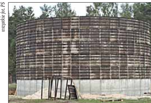
Stacja uzdatniania wody w Janówku Pierwszym

Drugą ważną inwestycją jest stacja uzdatniania wody w Janówku Pierwszym wraz z siecią wodociągową w ramach zadania „Wodociągowanie środkowo – zachodniej części Gminy” Projekt to ujęcie wód podziemnych składający się z dwóch studni o głą-