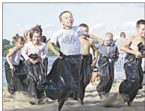
Na miejsce, gotowi...