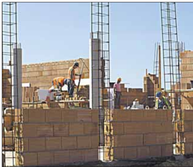
Rośnie następna kondygnacja

Budynek przyszłego Gimnazjum w Wieliszewie pnie się w górę. Mimo ulewnego lata budowlancy nie próżnowali i zakończyli etap parterowy.