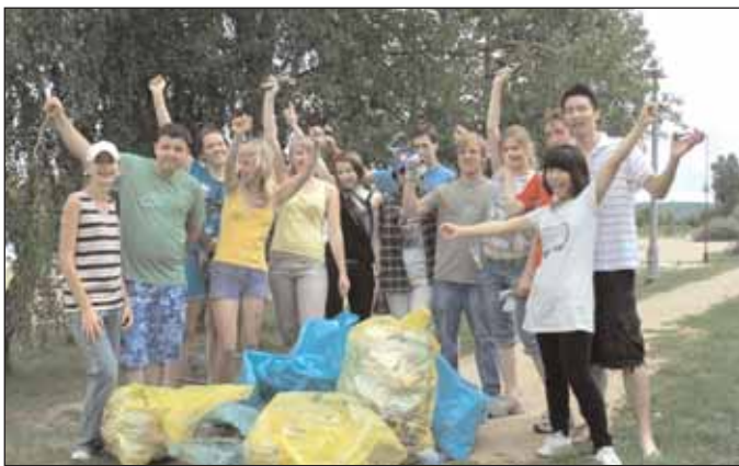
Niechlubne „trofea” zebrane