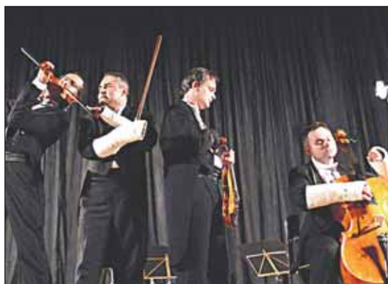
Grali do upadłego