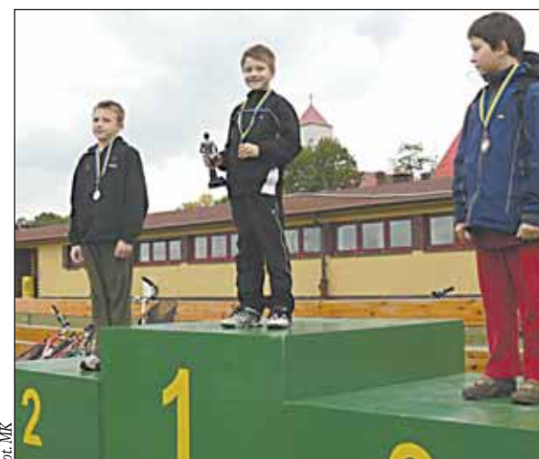
Młodzi potraktowali bieg poważnie