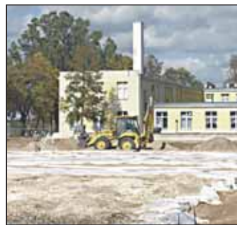
Orlik wylądował w Skrzyszewie