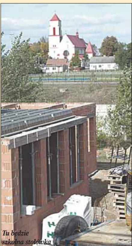
Tu będzie szkolna stołówka

Wysunięty na północ aneks będzie obejmował magazyny żywności, magazyny produktów suchych, zmywalnię, obieralnię, kuchnię i oczywiście stołówkę, w której jednorazowo posiłki będzie mogło spożywać 80 osób. W pozostałych elementach budynku trwają intensywne prace na pierwszej kondygnacji.