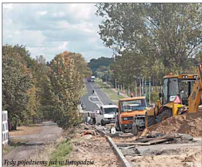
Tędy pojedziemy już w listopadzie

Przebudowa wiaduktu w Skrzyszewie trwa. Drogowcy obiecują, że nowa konstrukcja będzie gotowa do 15 listopada