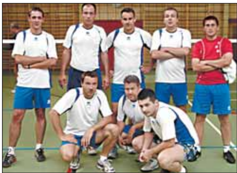
Bodzio Team wygrał rywalizację w grupie B

Do zawodów zgłosiło się 8 drużyn. W grupie A rywalizowały z sobą następujące drużyny: Lodołamacz, Vega, SPR oraz Grand. W grupie B między sobą rywalizowały UKS 1, Białostrzegi, KST i Bodzio Team. Grupę A zdecydowanie wygrał Lodołamacz wygrywając swoje trzy spotkania (jedno 2:1) pozostałe 2:0, mimo, iż zawodnicy tej drużyny grali w piątkę. Drugie miejsce zajęli zawodnicy Vegi, trzecie SPR, natomiast ostatnie miejsce zajął Gran, który nie przyjechał na Turniej w swoim najsilniejszym składzie. W grupie B zwycięstwo odniosła drużyna Bodzio Team, która w rozgrywkach Ligi stawia swoje pierwsze kroki pokonując pozostałe drużyny z grupy po 2:0. Pozostałe miejsca zostały rozstrzygnięte