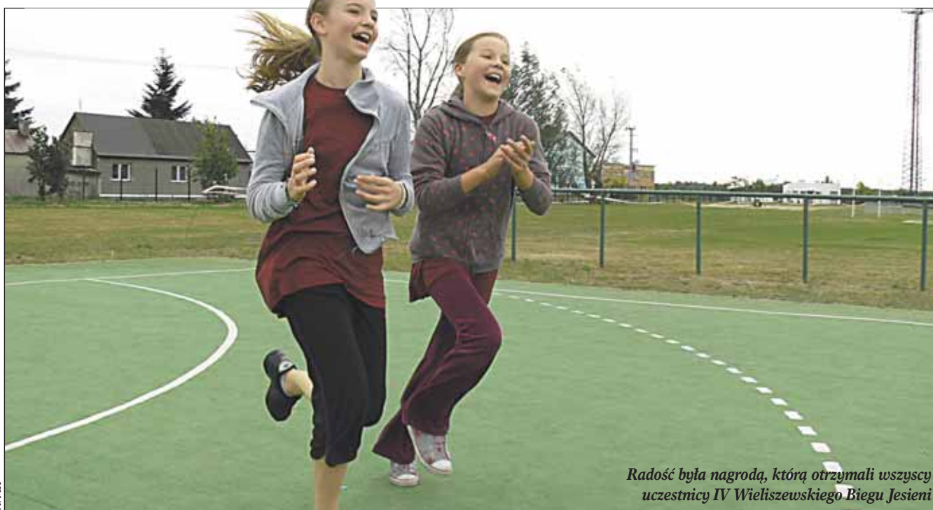
Radość była nagrodą, którą otrzymali wszyscy uczestnicy IV Wieliszewskiego Biegu Jesieni

Organizatorzy – Ośrodek Kultury w Wieliszewie, Referat Sportu oraz Referat Informacji i Promocji Urzędu Gminy Wieliszew wraz ze Stowarzyszeniem „Młodzi dla Rozwoju eMka” – zapewnili uczestnikom batony energetyczne i napoje.