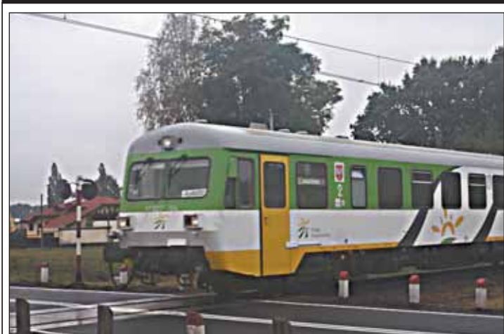
Komfortowo to znaczy bez wybojów

Przejazd kolejowy na ulicy Nowodworskiej w Michałowie-Reginowie był zmartwieniem kierowców. Nierówna nawierzchnia, psujące się rogatki powodowały, iż przejazd tym miejscem bywał mocno utrudniony.