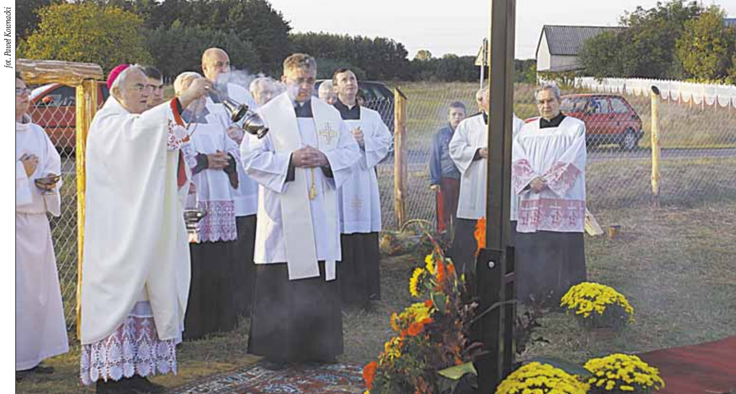
W tym miejscu stanie wkrótce kościół nowej parafii