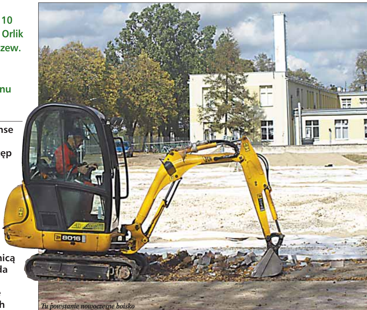
Tu powstanie nowoczesne boisko

Planowanej budowie boiska informowaliśmy już na stronach Gazety Wieliszewskiej. Teraz możemy poinformować, że budowa inwestycji ruszyła. Boisko Orlik dla Gminy