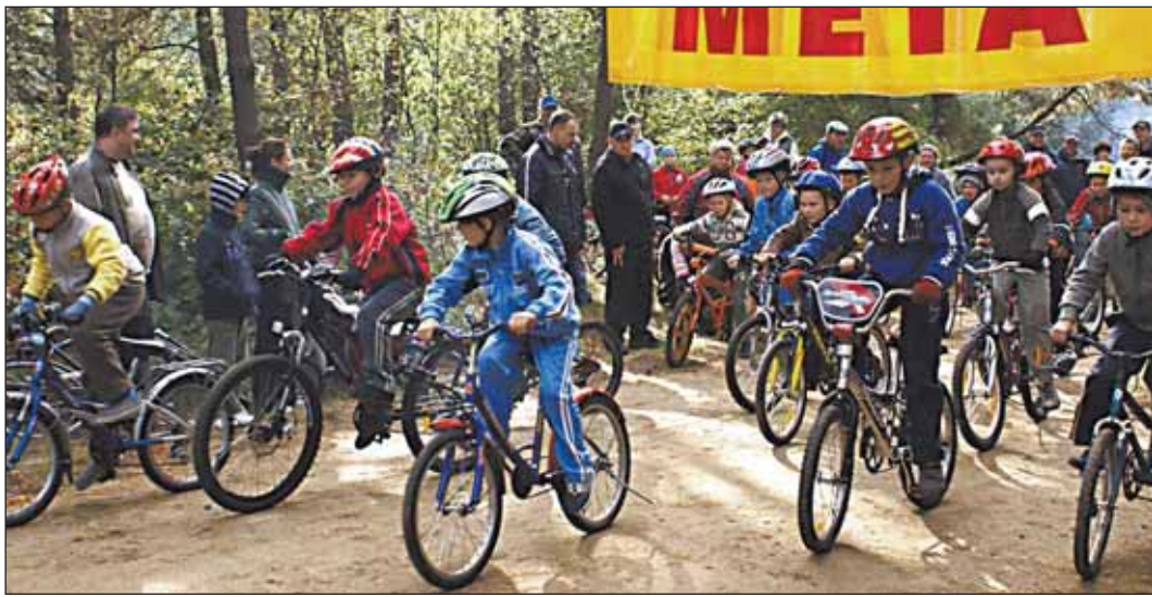
Na trasie dominowała jazda szybka...