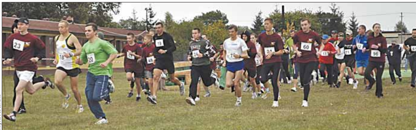
Start do biegu głównego