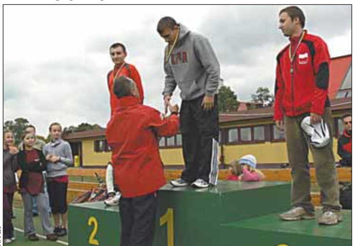
Zwycięzcy biegu głównego