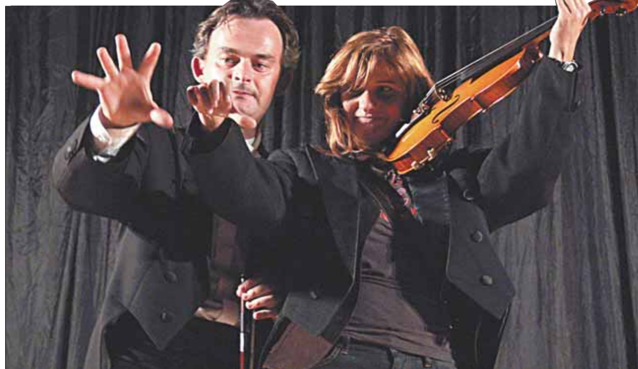
Przyspieszony kurs gry na instrumencie