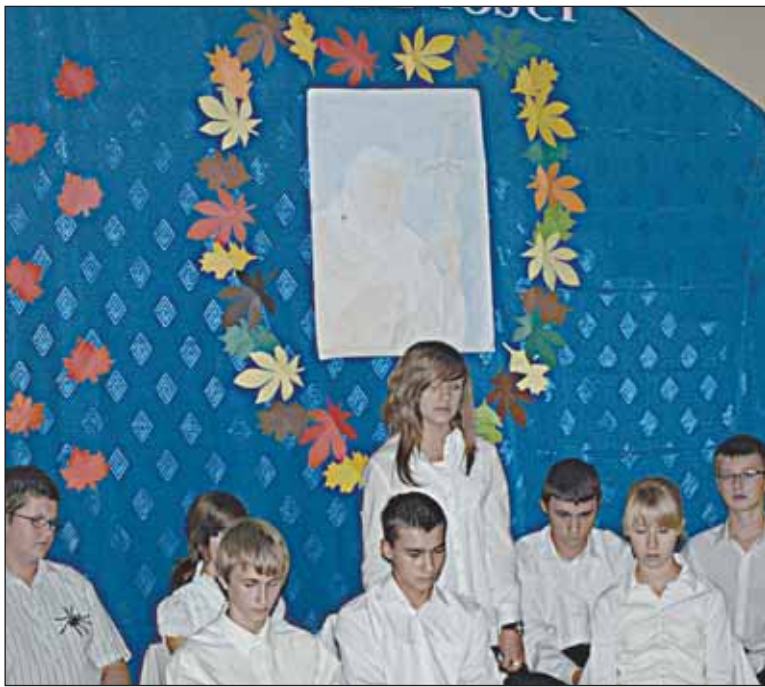
Recytacja w Wieliszewie