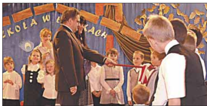
Witajcie w naszej szkole – Łajski