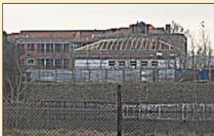
Gimnazjum z dystansu ... i z bliska