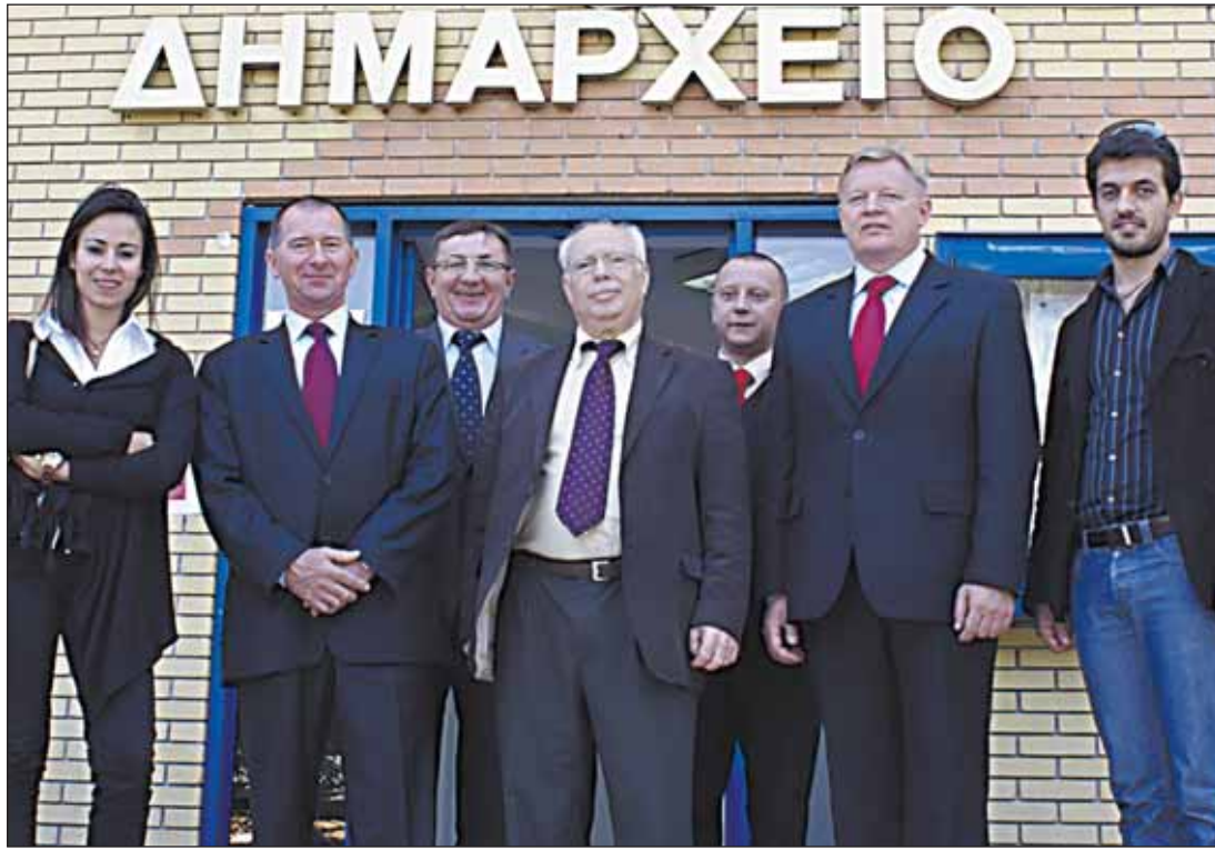
Przedstawiciele Gminy Wieliszew i zaprzyjaźnionej Gminy Agios Stefanos

Około 30 km na północ od Aten, ponad 10 tysięcy mieszkańców, podobne problemy i szanse rozwoju – tak wygląda Agios Stefanos, kolejna Gmina bliźniacza Wieliszewa.