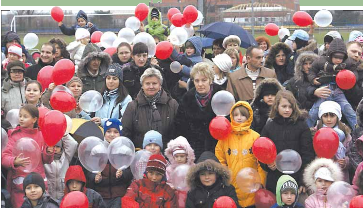
Idea naszej wolności wzniesie się do nieba...