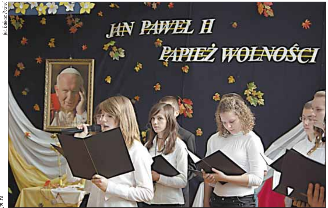
... i w Skrzeszewie