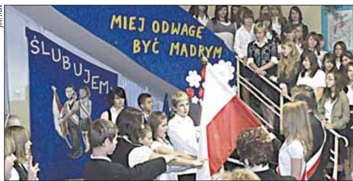
Ślubowanie w wieliszewskim Gimnazjum