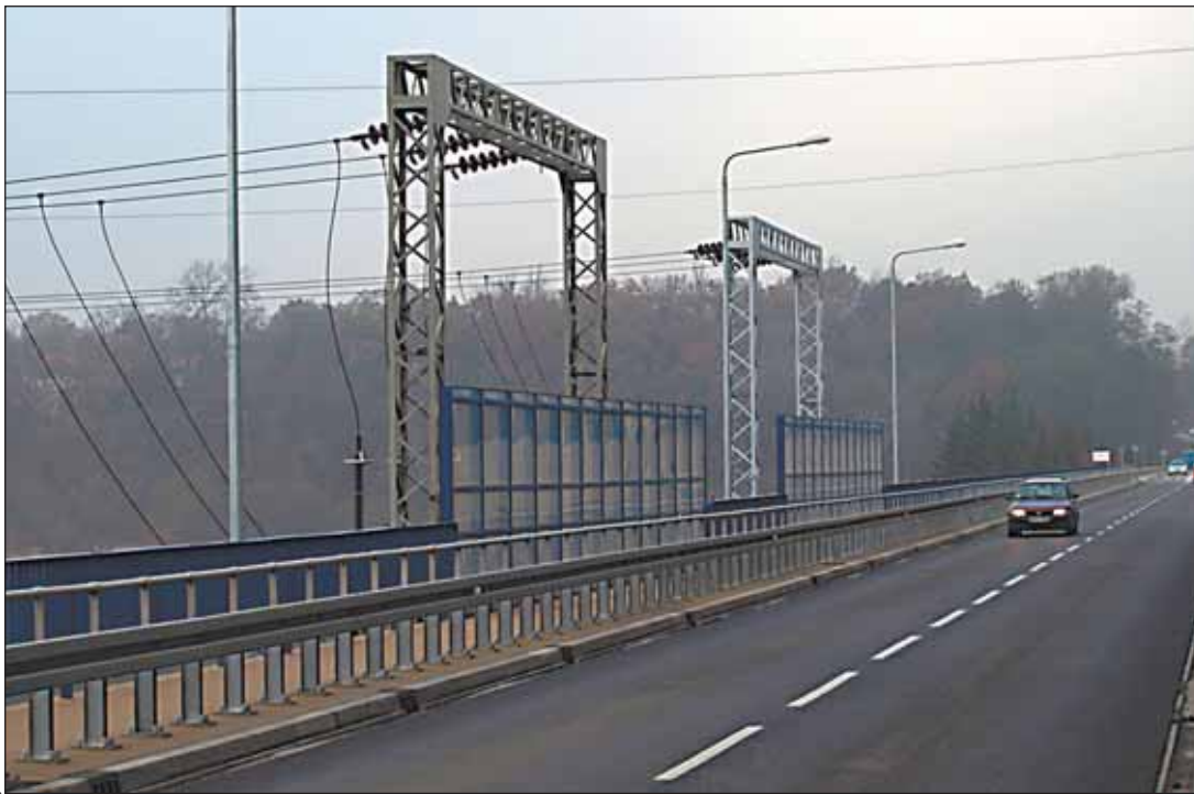
Nowe punkty świetlne na zaporze w Dębem

cją ratownictwa drogowego na potrzeby jednostki OSP Skrzyszew. Koszt zakupu pojazdu wynosił 188 020 zł, w tym dotacja z Samorządu Województwa 70 000 zł i 12 000 zł. z Powiatu Legionowskiego. Wkład Gminy Wieliszew wyniósł 76 020 zł, a wkład własny OSP Skrzyszew 30 000 zł.