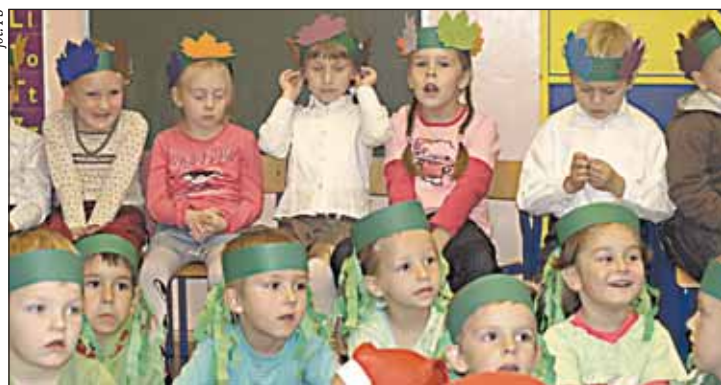
Przed pasowaniem w wieliszewskim Przedszkolu