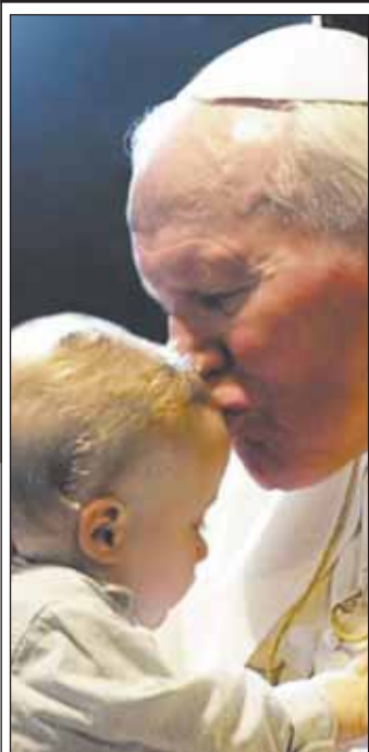
Rokrocznie 16 października obchodzimy w Polsce Dzień Papieski – święto państwowe ustanowione w 2001 roku.

» relacja z Dnia Papieskiego w Gminie czytaj str. 3