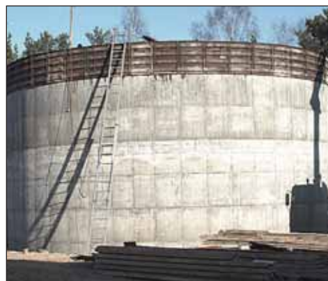
Stacja Uzdatniania Wody

Ponadto ze względu na nietypową topografię skrzyżowania, przez które codziennie przechodzą dzieci udające się do szkoły przy ul. Dworcowej, skrzyżowanie powinno być lepiej oświetlone, a szczególnie dotyczy to