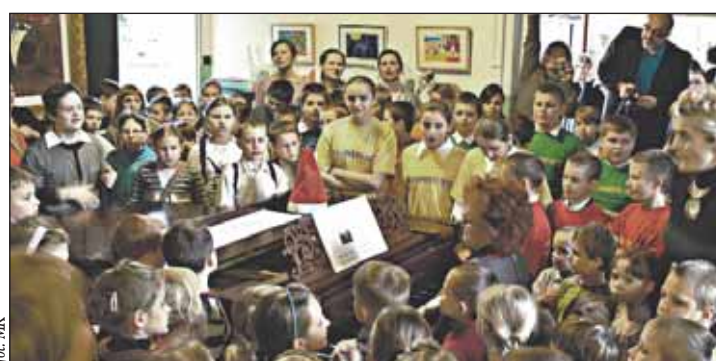
Oryginalne rozpoczęcie Konferencji

W ramach spotkania uczestnicy wysłuchali wykładów na temat realizacji edukacji włączającej w szkole masowej, roli asystenta ucznia niepełnosprawnego; uczestniczyli w warsztatach dotyczących integracji sensorycznej, muzykoterapii, arteterapii, alternatywnych metod komunikacji. Znalazł się czas również na dyskusję. Ponieważ była to już druga tego typu konferencja w Łajskach, nie mogło