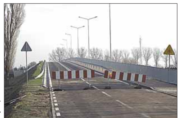
Wiadukt w Skrzeszewie