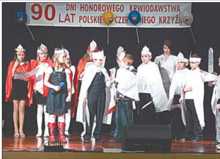
W hołdzie honorowym dawcom krwi

Uroczystość była radosnym świętem – poza okolicznościowy-