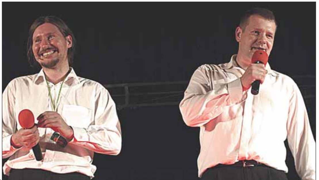
Okazuje się, że męski szowinizm może też rozśmieszać

■ Dyrektor Przedszkola nr 2 Małgorzata Sobieraj