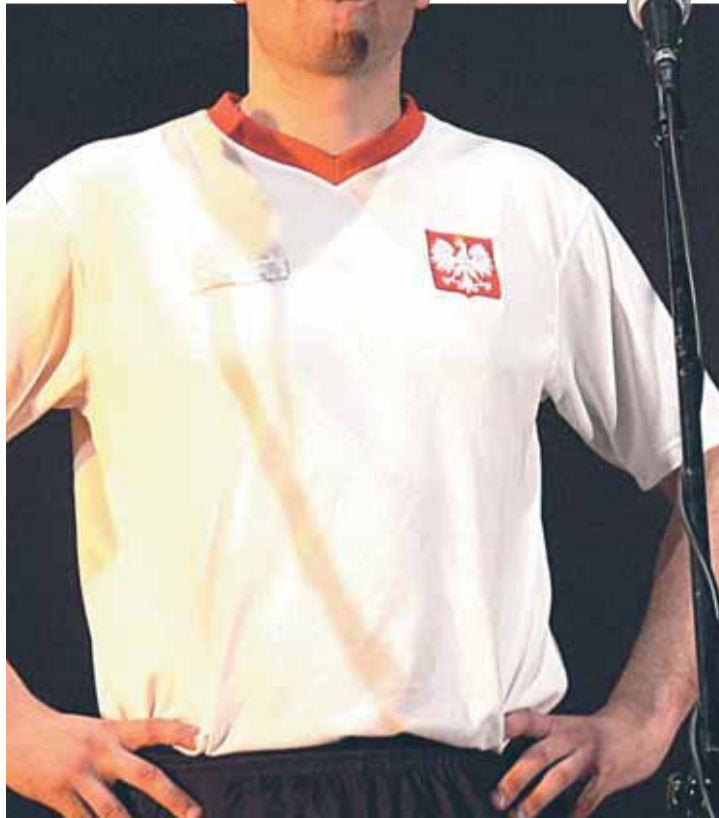
„Cały czas do przodu” – taktyka reprezentacji

Grupa zaprezentowała nam takie skecze jak: Śruba, Śruba na sylwestra, Trfama telegra, czy Hymn Euro 2012. Kabaret Skeczów Męczących po-