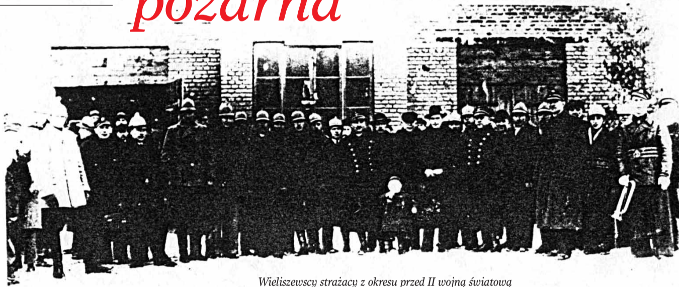
Wieliszewscy strażacy z okresu przed II wojną światową

Zainspirowany materiałami przekazanymi przez Pana Boryszewskiego, niestety w postaci kserokopii, postanowiłem zgłębić temat. Szkoda tylko, że nie zachowały się oryginały. Zdjęcia skserowane na początku lat 90-tych są jakościowo dalekie od oryginału. Dzisiejsza technika może znacznie więcej, tylko gdzie są oryginały??? W przyszłym roku wieliszewska OSP będzie obchodzić 90 rocznicę. Powinienem wstrzymać się z artykułem do przyszłego roku ale postanowiłem zadziałać powakacyjnie, może na tak piękną rocznicę znajdą się jakieś materiały z zagubionych, aby uczcić takie ważne wydarzenie. Maj, to miesiąc w którym strażacy mają swoje święto i to jest drugi powód mojego artykułu.