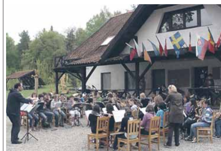
Wspólna próba orkiestr w Rodowie

Od 9 do 15 maja polskie i niemieckie dzieci wzięły udział w programie „Muzyczna podróż na Mazury”