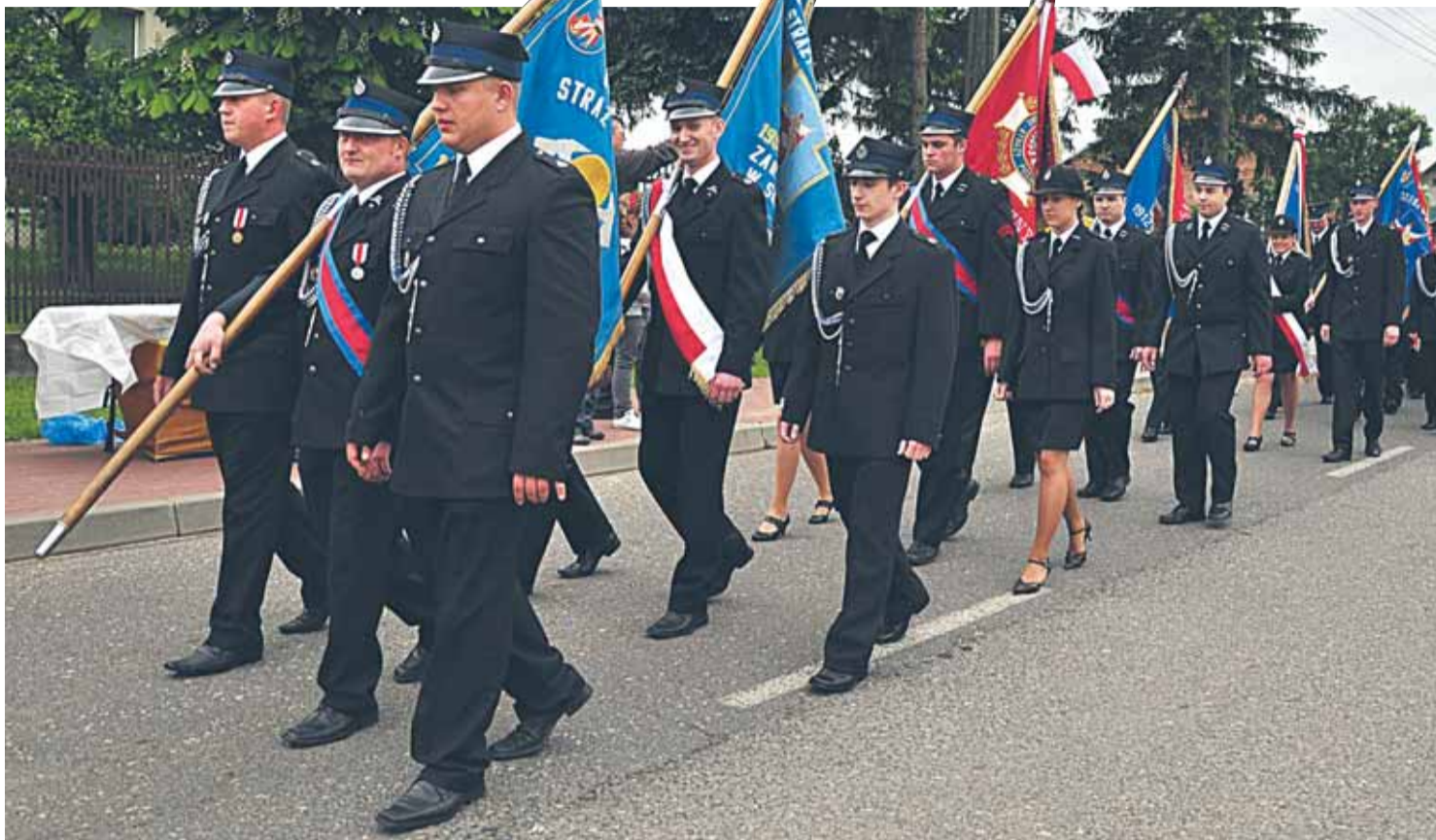
W defiladzie uczestniczyło 6 pocztów sztandarowych