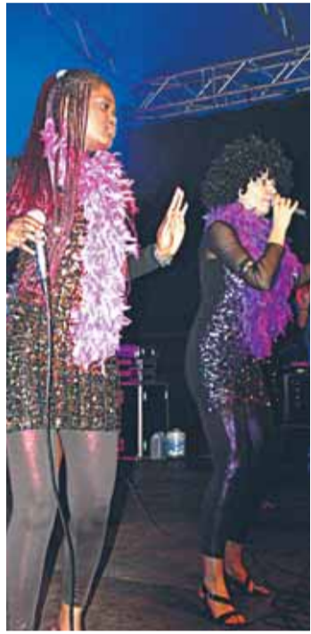
Babylon przypomina Boney M