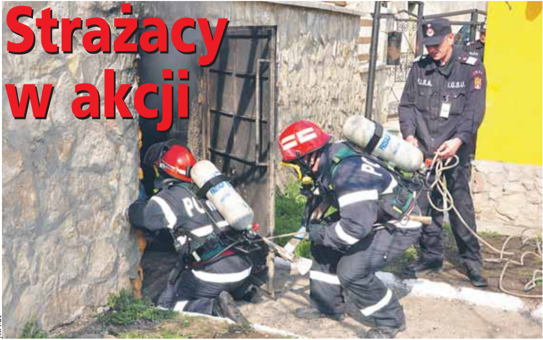
Strażacy z rumuńskiego Siretu podczas ćwiczeń, w których brali udział również druhowie z Gminy Wieliszew

nówka, Kałuszyna, Skrzyszewa, Wieliszewa, Legionowa i Nowego Dworu Mazowieckiego gasiły pożar poszycia w Krubinie. Spłonął 1 ha lasu. Dzięki szybkiej interwencji nie doszło do rozprzestrzenienia się pożaru na większą powierzchnię. Tego samego dnia, wieczorem, na ul. Nasielskiej w Skrzyszewie doszło do wypad-