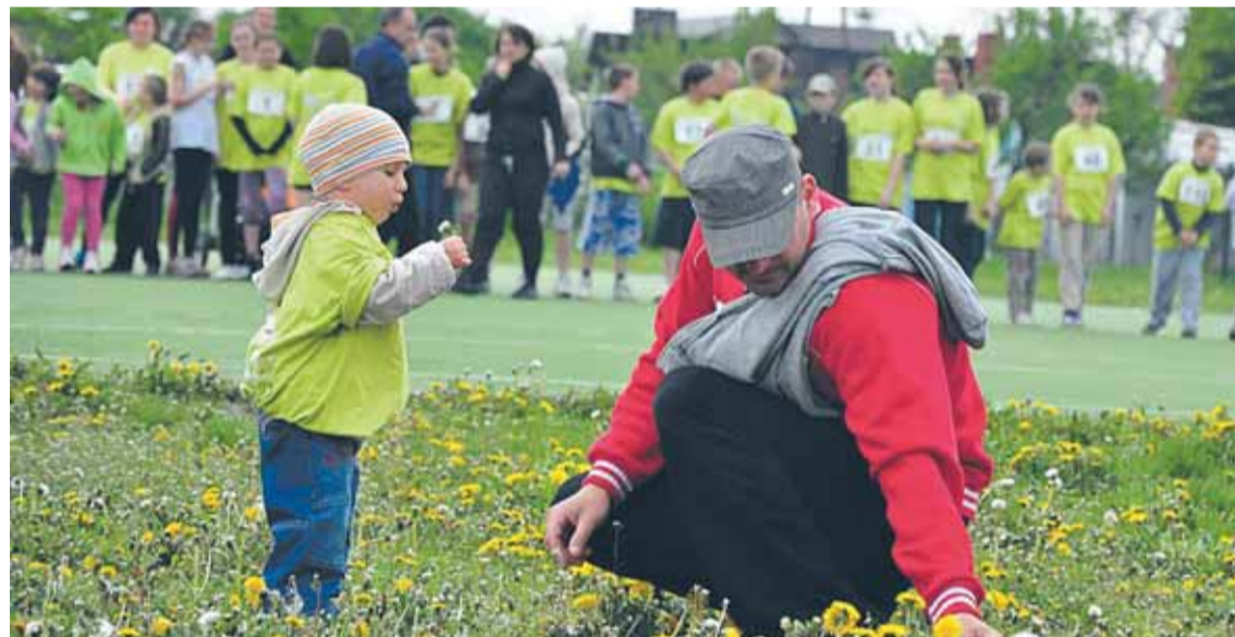
Bieg rodzinny jest kwintesencją akcji Polska Biega