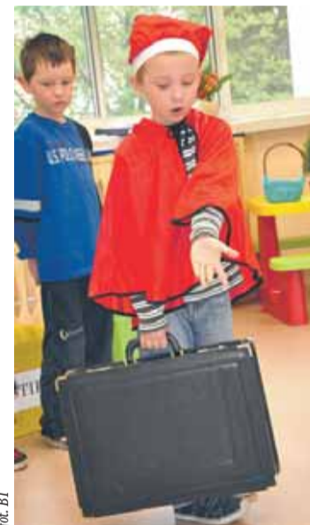
Opady można zbierać nawet w neseser