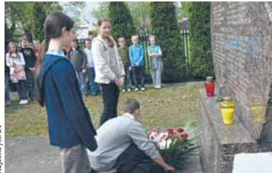
Dzieci składają hołd poległym żołnierzom