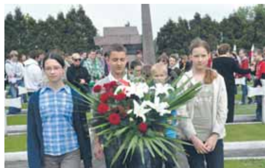
Uroczystości towarzyszyła podniosła atmosfera