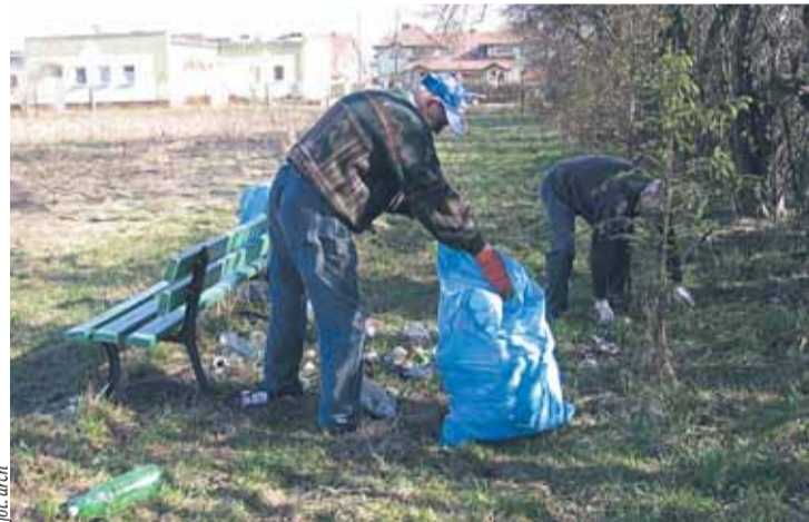
W tym roku śmieci było dużo mniej

Aktywność organizatorów grup zbierających w tej akcji była różna. Ubiegłoroczna akcja miała swój pozytywny skutek w tym, że śmieci do zebrania w tym roku było zdecydowanie mniej (ok. 25 proc. tego co w ubiegłym roku). Myślę, że również pozytywny skutek miała wzrastająca świadomość mieszkańców o potrzebie utrzy-