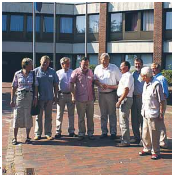
Przed Urzędem w Trittau

G mina Salaspils leży 20 km na wschód od stolicy kraju Rygi, nad sztucznym zbiornikiem wodnym na Dźwinie. Liczy 21 tysięcy mieszkańców. Dla łatwiejszej lokalizacji gminy w świadomości naszych mieszkańców wystarczy przytoczyć informację, iż do początków XX wieku Salaspils nosiło nazwę Kircholm. Tutaj miało miejsce jedno z największych zwycięstw oręża polskiego, kiedy w 1605 r. wojska polskie pod wodzą hetmana Chodkiewicza pokonały przeważające siły szwedzkie.