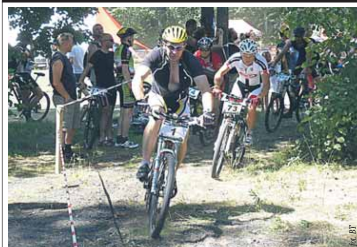
Zawodnicy zmagali się z upałem

Organizatorzy zapowiedzieli, że za rok nasza Gmina będzie gospodarzem III Mistrzostw. ■