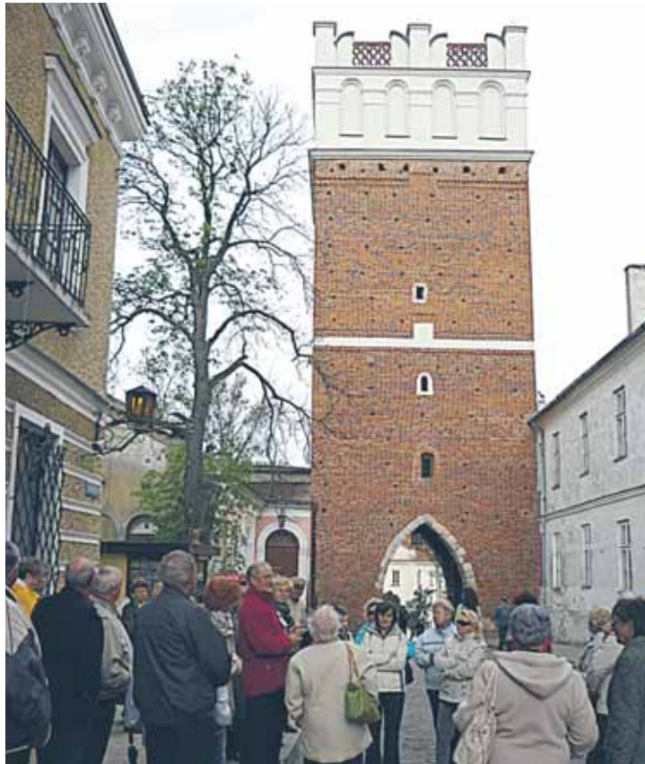
Brama Opatowska w Sandomierzu

Jeszcze 28 kwietnia klubowicze i klubowiczki z Klubu Seniora z Łajsk pojechali na jednodniową wycieczkę do Sandomierza, zwanego „małym Rzymem”. Tam zwiedzili Bazylikę Katedralną Narodzenia Najświętszej Maryi Panny i Kościół św. Jakuba. Mieli też okazję podziwiać unikalną panoramę tego miasta. Idąc za ciosem 22 maja wyruszyli do Kazimierza Dolnego i Nałęczowa, gdzie spacerowali po Parku Zdrojowym, który otacza Pałac Małachowskich i pijalnię wody, w której znajduje się palmiarnia. Zwie-