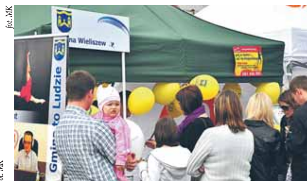
Stoisko Urzędu Gminy Wieliszew