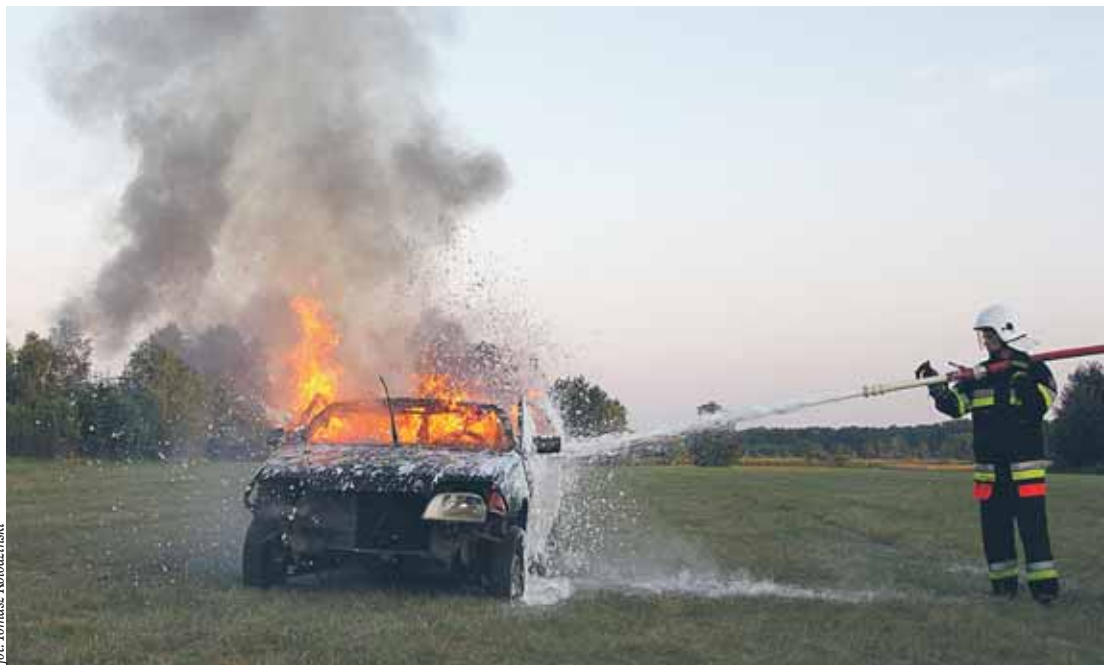
Strażacy podnoszą kwalifikacje ćwicząc nieustannie

Natura w tym roku nie jest dla nas łaskawa. Na początku musieliśmy się zmierzyć z obfitymi opadami śniegu, później z pożarami traw a ostatnie dwa miesiące to dla strażaków czas wyjątkowej pracy. Wiadomo było, że fala kulminacyjna nie ominie naszych terenów. Już 18 maja zapadła decyzja o przygotowaniu sprzętu przeciwpowodziowego. A wszyscy strażacy zostali postawieni w stan gotowości. Prowadziliśmy działania od 20 maja do 13 czerwca. Umacnialiśmy wały, a także prowadziliśmy ich kontrole od grani-