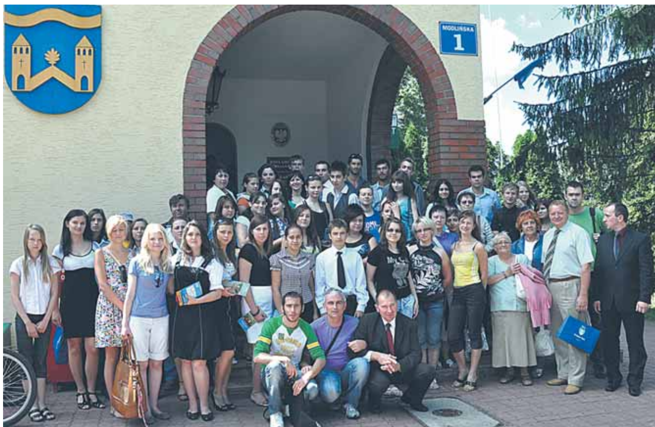
Wszyscy nasi przyjaciele