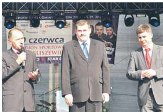
Powitanie gości Święta Gminy