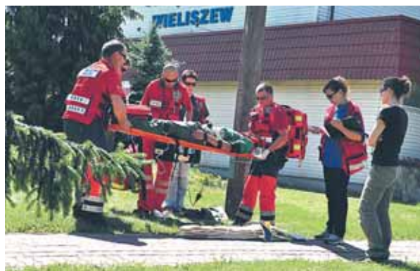
Transportowanie rannego na desce ortopedycznej