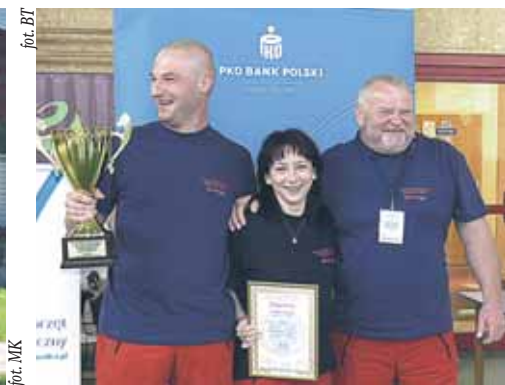
Zwycięzcy ze Stacji w Pszczynie

Ponad 30 zespołów, w tym jeden ze Szwecji, brało udział w II Mistrzostwach Ziemi Mazowieckiej w Ratownictwie Medycznym, które odbyły się 16-18 czerwca, na terenie Gmin Wieliszew i Serock.