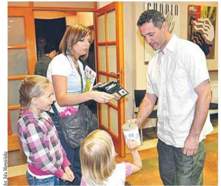
Młodzi uczą się wspierać potrzebujących

na zakup wyprawek szkolnych, podręczników, pomocy naukowych i innych artykułów edukacyjnych. Pieniądże można wpłacać na konto nr 16 1020 1026 0000 1102 0172 1471 w PKO BP.