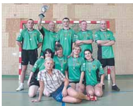
wygrała Gmina Jabłonna