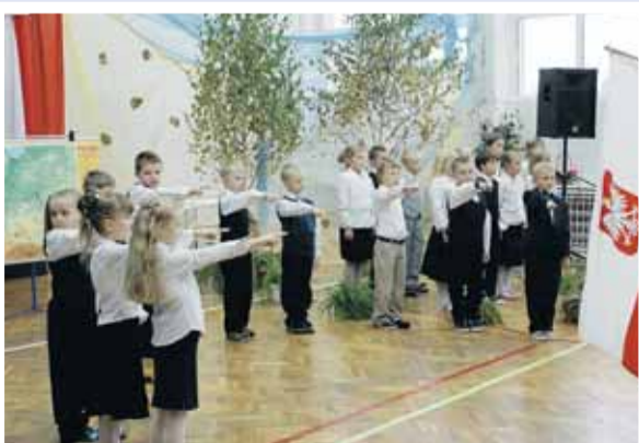
Ślubowanie pierwszej klasy ze Szkoły Podstawowej w Skrzeszewie