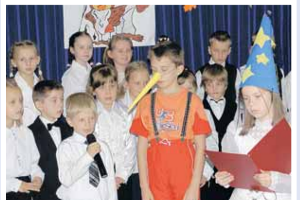
Program artystyczny pierwszaków przy wsparciu starszych kolegów w Szkole Podstawowej im. Tadeusza Kościuszki w Wieliszewie