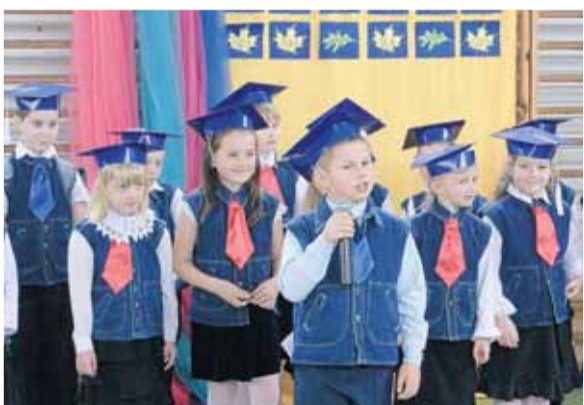
Prawdziwi aktorzy w szkolnych mundurkach w Szkole Podstawowej im. Józefa Wybickiego w Janówku

Bardzo bym chciała zostać weterynarzem, dlatego że bardzo fajnie jest leczyć zwierzęta.