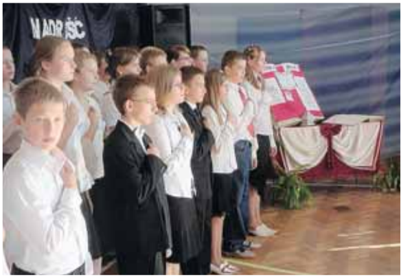
Ślubowanie uczniów w klasie pierwszej Gimnazjum w Skrzeszewie