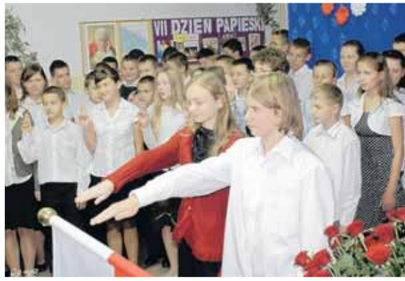
Ślubowanie uczniów w klasie pierwszej Gimnazjum w Wieliszewie