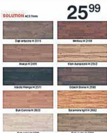
Panele podłogowe Egger Solution