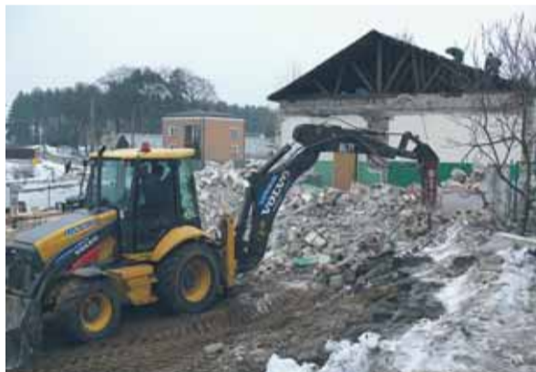
To samo miejsce na początku 2011 roku

OSP Kałuszyn będzie miało nowoczesną remizę z zapleczem socjalnym. Przy ulicy Mickiewicza 7 trwa przebudowa starego budynku.