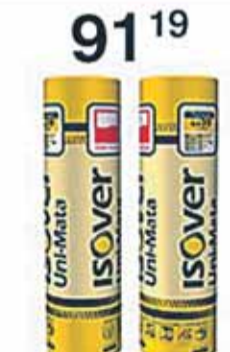
Wełna Uni-Mata gr.100mm (9,6m 2 )