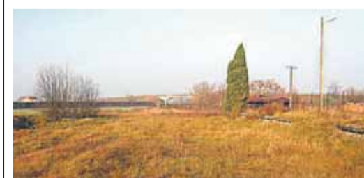
Tym razem przedstawiam Czytelnikom GW fragment zdjęcia (niestety mało wyraźny), prawdopodobnie przedstawiający wiadukt w Skrzesz-

wie w 1939 r., tuż po wkroczeniu Niemców na nasz teren. Od długiego już czasu poszukuje jakiegos zdjęcia przedstawiającego ten wiadukt zaraz po wojnie lub po jego oddaniu do użytkowania w 1939 r. Prawdopodobnie wiadukt został zniszczony w czasie działań wojennych 1944 r. a odbudowany został w latach 50-tych