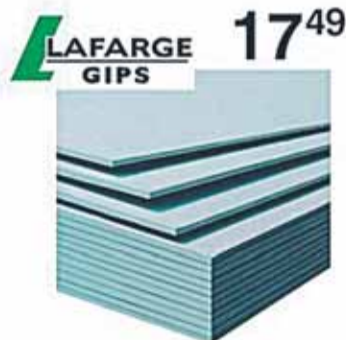
Płyta gipsowo-kartonowa standard 12.5mm 2.6m