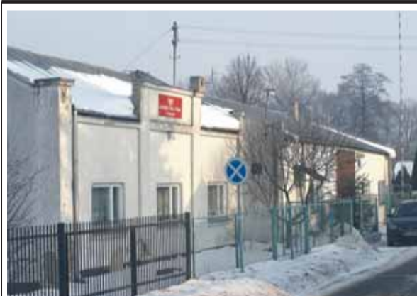
Strażnica w 2010 roku