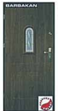
Drzwi zewnętrzne metalowe Barbakan 90 cm