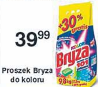
Proszek Bryza do koloru