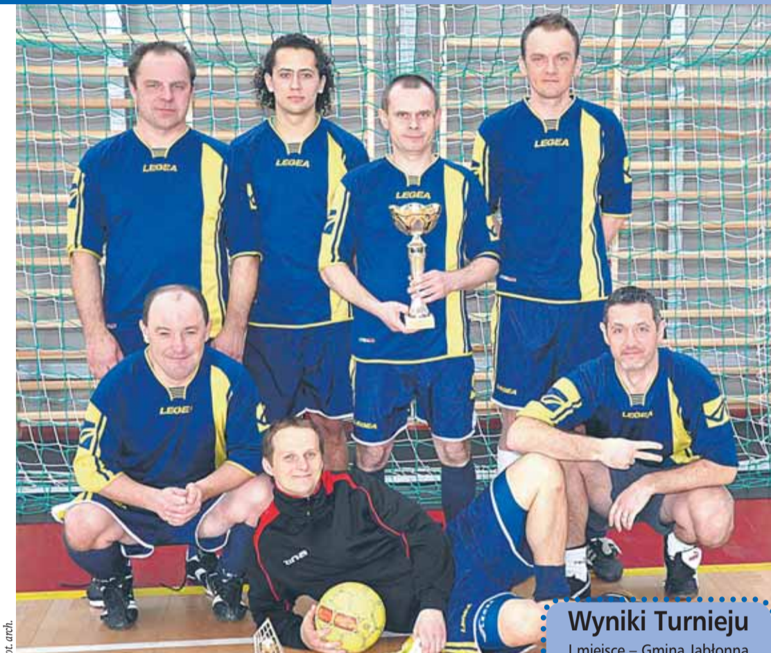
Reprezentacja urzędników z Gminy Wieliszew

Rywalizacja przebiegała z reguły w przyjacielskiej atmosferze, a powstające w ferworze walki spięcia łagodziła świadomość, że celem imprezy jest integracja środowisk samorządowych powiatu legionowskiego.