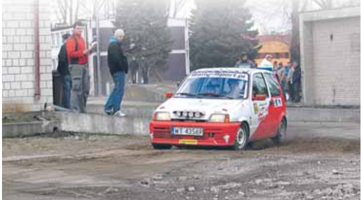
Próby uliczne należą do najbardziej widowiskowych

Wyścig rozegrał się w pięciu lokalizacjach, na około 80-kilometrowej trasie, w obrębie Warszawy, Legionowa i Nowego Dworu Maz. Trzy próby zawodów odbyły się w Michałowie-Reginowie: pierwsza – na opuszczonym placu, przy ul. Nowodworskiej 6, gdzie kierowcy musieli wykazać się dużymi zdolnościami manewrowymi, druga – na prostym odcinku z jednym wirażem, a trzecia – szybka i widowiskowa, na drodze prowadzącej do ujęcia wodnego.