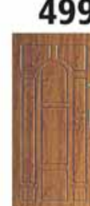
Drzwi wewnętrzne wejściowe Door-Pol Impero

Michałów-Reginów, ul. Nowodworska 9 tel. 22 772 11 81, kom. 608 921 201 • www.chemko.pl • chemko@chemko.pl Market budowlany Chemko otwarty na okrągło: pn-sob. 6.00–20.00, nd. 9.00–18.00