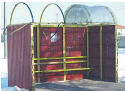
Zdewastowany przystanek w Skrzyszewie

Gmina wymienia zniszczone przez chuliganów przystanki autobusowe. Apelujemy o piętnowanie wandal!