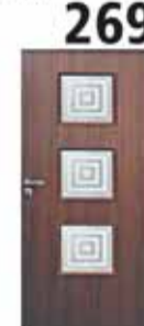
Drzwi wewnętrzne Door-Pol Toledo