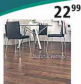
Panele podłogowe Kaindl dąb – 1m 2