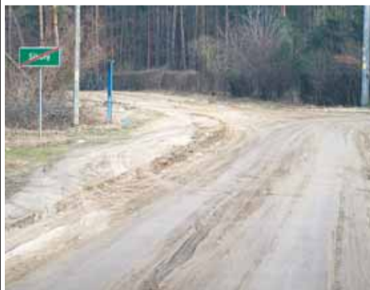
Ulica Główna w Sikorach jest już przejezdna

Urząd Gminy Wieliszew reaguje na zgłoszenia mieszkańców dotyczące uszkodzeń infrastruktury. Na bieżąco naprawiane są nawierzchnie dróg i trwa oczyszczanie terenu.