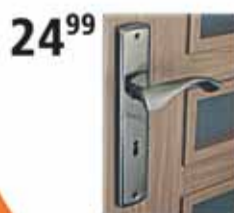
Klamka Domino Bilbao