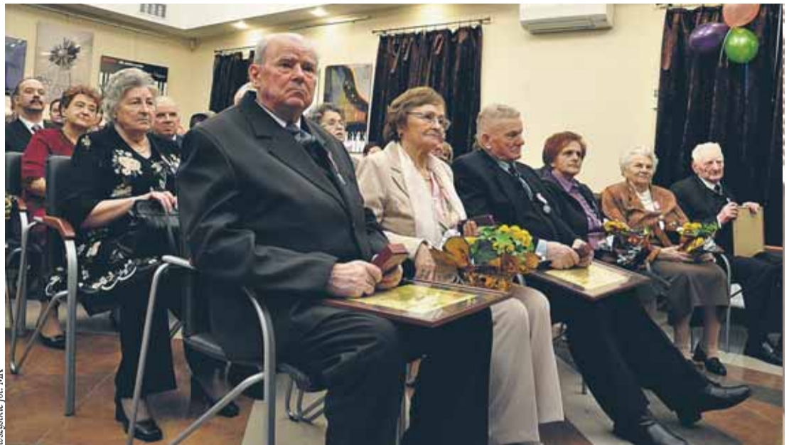
Uroczystość miała podniosły charakter, ale również rodzinną atmosferę