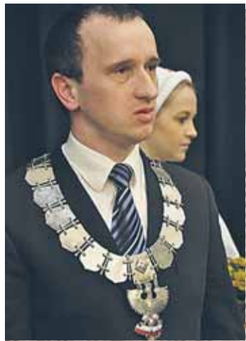
Wójt w roli Kierownika USC