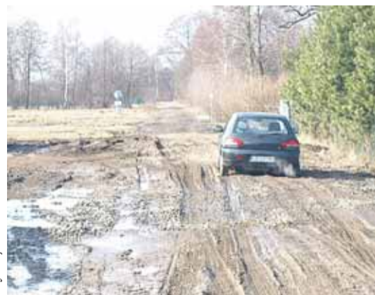
Utwardzona ulica Janiny w Skrzyszewie