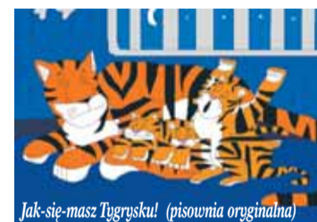
Jak się masz Tygrysku! (pisownia oryginalna)

uczestniczą w jej rozwoju. Strona Jeremiasza: www.jeremiaszpopiel.eu