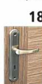
Klamka Domino Nova