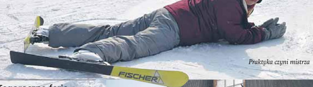
Praktyka czyni mistrza

Tegoroczne ferie w Gminie Wieliszew odbyły się pod znakiem sportu, kultury i edukacji. Uczestnicy mieli okazję wypróbować niekonwencjonalne formy spędzania wolnego czasu przebijając w bogatej ofercie. Niektórzy skusili się nawet na górską przygodę.