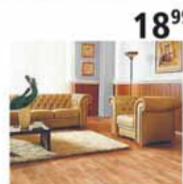
Panel podłogowy KRONO Original Dąb Savoyen – 1m 2