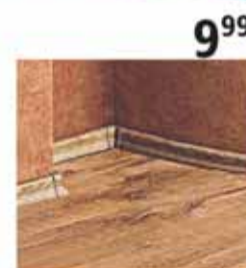
Listwa Arbiton LM55 2.5m