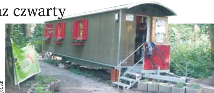
Niemieckie „leśne przedszkole”

Uczestnicy projektu wzięli udział także w zajęciach z dziećmi z „leśnego przedszkola”, poznając me-