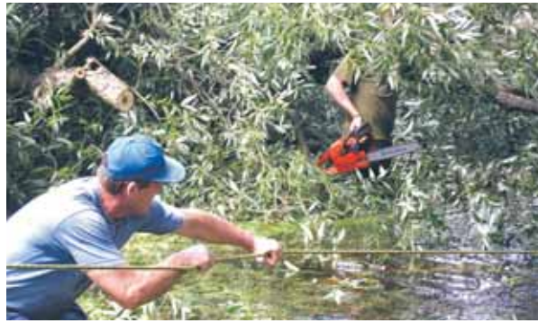
Pracownicy Urzędu usuwają zator na Kanale