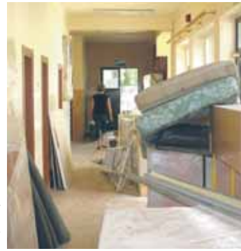
Zniszczenia w SP Skrzyszew