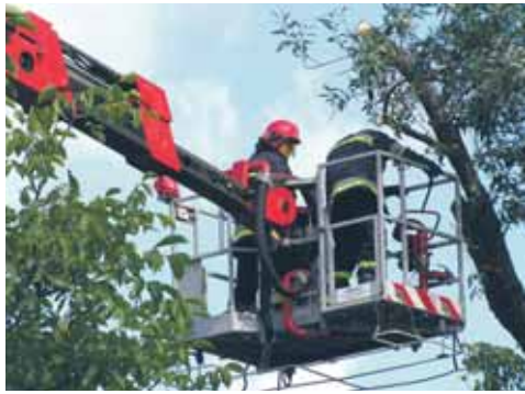
Usuwanie drzewa zwalzone na dom