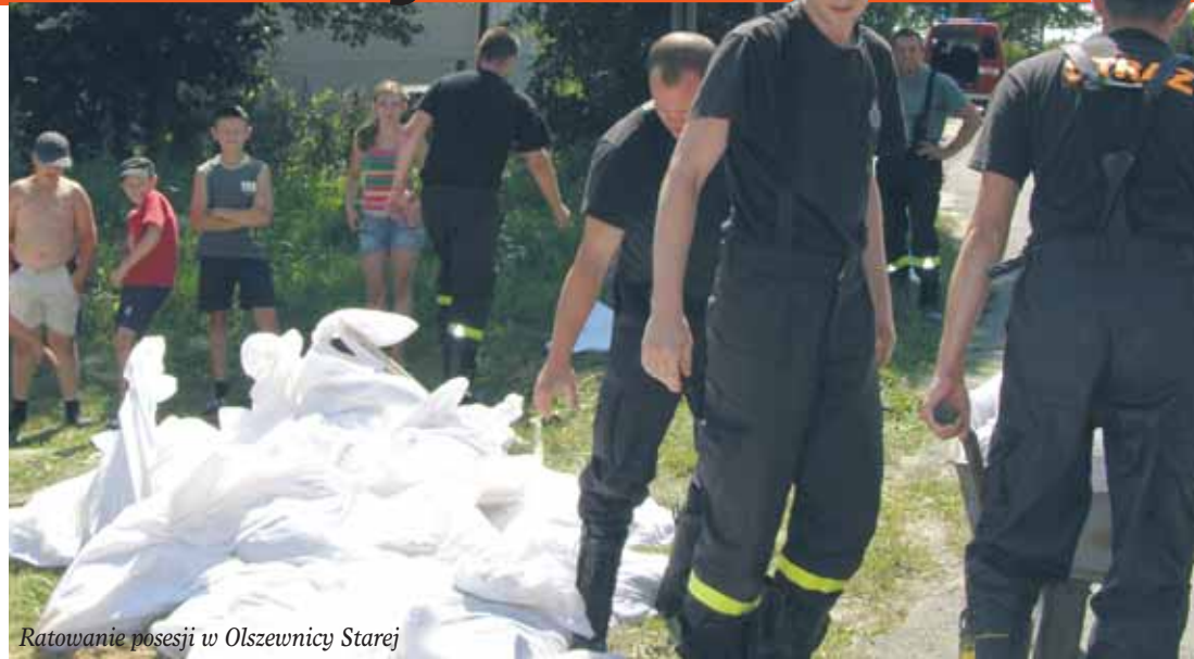
Ratowanie posesji w Olszewnicy Starej

Zachowanie przepisów i procedur, zatrudnienie profesjonalistów, wyposażenie w specjalistyczny sprzęt miało zapewnić maksimum bezpieczeństwa. A jednak, gdy 31 lipca stacja meteorologiczna w Dębem odnotowała rekordowe opady w historii pomiarów meteorologicznych – 59,8 litrów na metr kw., strażacy i urzędnicy znów musieli stawić czoło sytuacji kryzysowej. W ciągu ko-