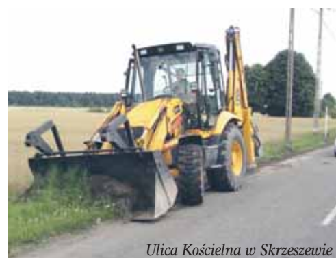
Ulica Kościelna w Skrzeszewie