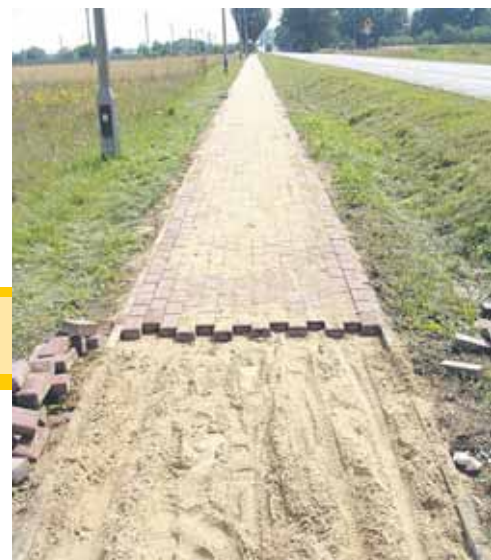
Chodnik łączący Skrzeszew i Kałuszyn