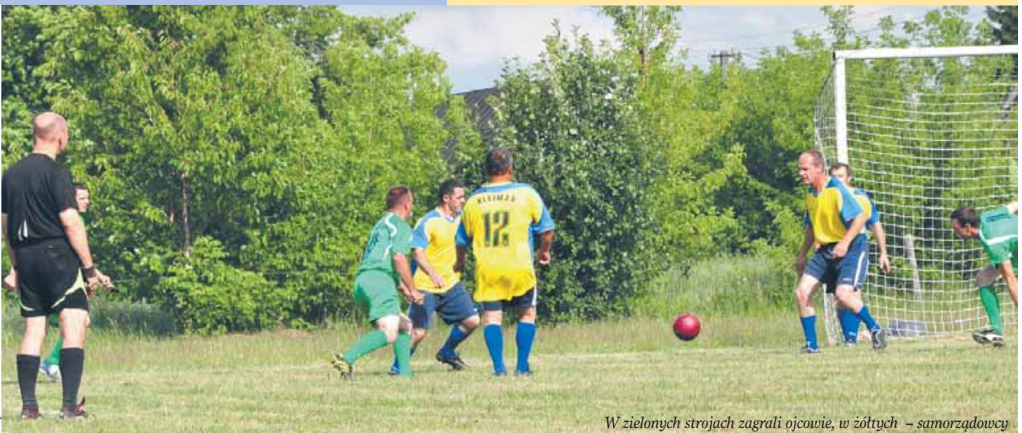
W zielonych strojach zagrali ojcowie, w żółtych – samorządowcy

znalazły się: dmuchane zjeżdżalnie, ruchoma ścianka wspinaczkowa, malowanie twarzy, basen z piłeczkami oraz przejażdżka bryczką. Oczywiście nie zabrakło tradycyjnej grochówki wojskowej, po której ustawiła się długa kolejka. Nie zabrakło również loterii fantowej z licznymi nagrodami.