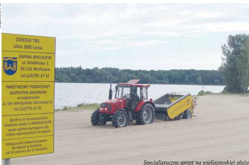
Specjalistyczny sprzęt na wieliszewskiej plaży