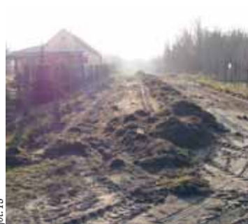
Prace na ul. Polnej w Wieliszewie