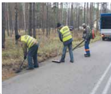
Prace porządkowe na Poddebciu