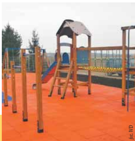
Plac zabaw przy SP w Wieliszewie