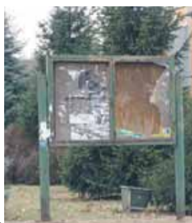
Zniszczona i odnowiona tablica informacyjna na osiedlu 600 lecia w Wieliszewie