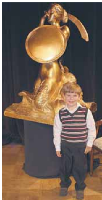
uzyskanie jst. arch.