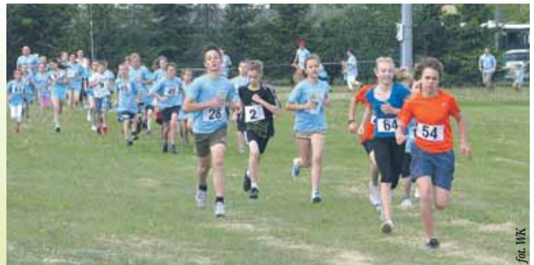
Jak co roku, tak również i tej wiosny odbył się w niedzielę, 20 maja VI Wieliszewski Bieg Wiosny, w którym wzięło udział ponad 100 zawodników.