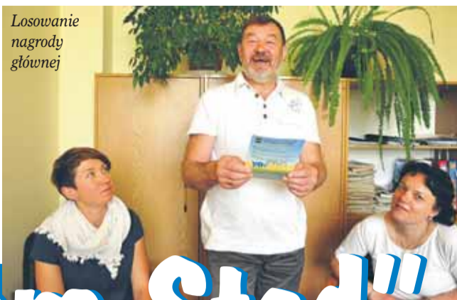
Losowanie nagrody głównej