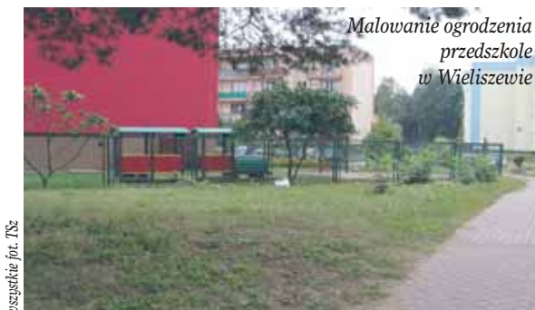
Malowanie ogrodzenia przedszkole w Wieliszewie