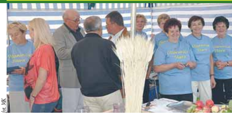
Stoisko Stowarzyszenia podczas Dożynek Gminnych 2012

W tym numerze Gazety spotykamy się z członkiniami „Stowarzyszenia Ludzi Aktywnych-Przyszłość” z Olszewnicy Starej.