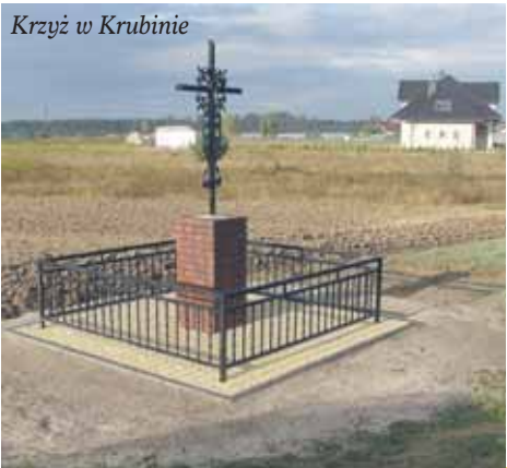
Krzyż w Krubinie