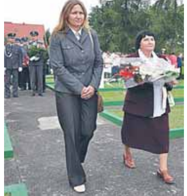
Delegacja Gminy Wieliszew