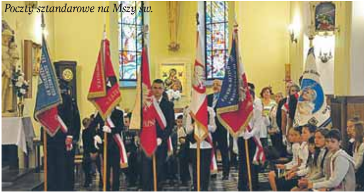
Pocztę sztandarową na Mszy św.

Uroczystości zakończyły się złożeniem kwiatów pod pomnikiem upamiętniającym tragiczne wydarzenie sprzed 73 lat. Wymownym symbolem i wyjątkową okolicznością był udział w uroczystości potomków jednego z żołnierzy, którzy we wrześniu 1939 poległ na terenie naszej Gminy i tu spoczęli wraz z pozostałymi zabitymi