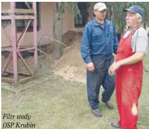
Filtr wody OSP Krubin