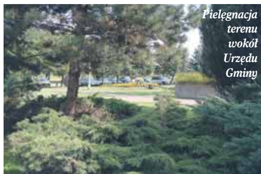
Pielęgnacja terenu wokół Urzędu Gminy