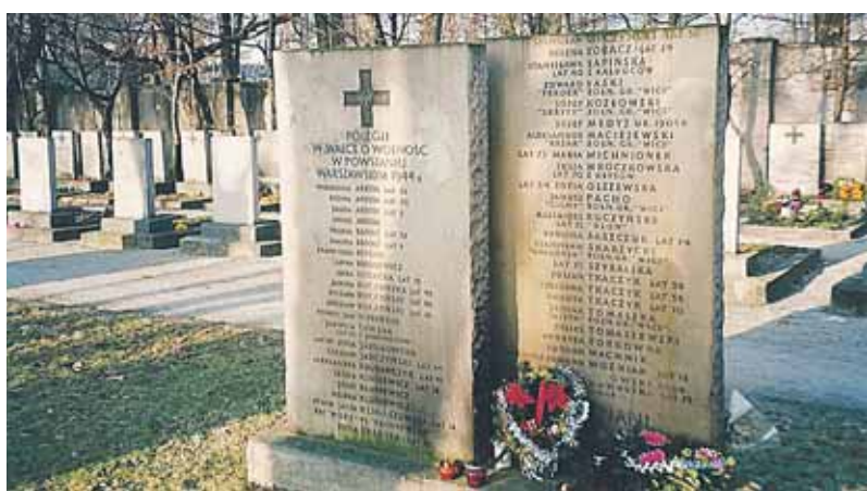
Pomnik na Cmentarzu Powstańców Warszawskich na Woli, gdzie po ekshumacji w lutym 1958 r. przeniesiono ciała pomordowanych na Nowopolu.