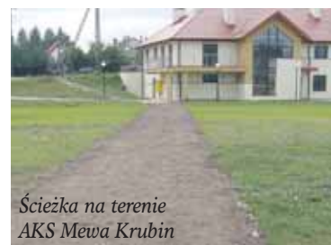
Ścieżka na terenie AKS Mewa Krubin

Pracownicy Gminy skosili trawę na skwerze Paczkowskiego, na terenie przy Urzędzie Gminy i w Janówku Pierwszym, a także na osiedlu 600-lecia w Wieliszewie, przy ul. Nowodworskiej i wokół boiska w Wieliszewie. Dodatkowo wycięli krzaki na ul. Pięknej w Michałowie-Reginowie.