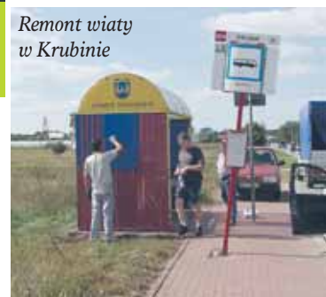
Remont wiaty w Krubinie