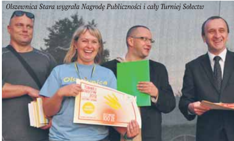
Olszewnica Stara wygrała Nagrodę Publiczności i cały Turniej Sołectw

W imieniu mieszkańców wsi Krubin, Ochotniczej Straży Pożarnej w Krubinie oraz Amatorskiego Klubu Sportowego „Mewa” Krubin, pragnę serdecznie podziękować za przekazanie nam tego okazałego budynku.