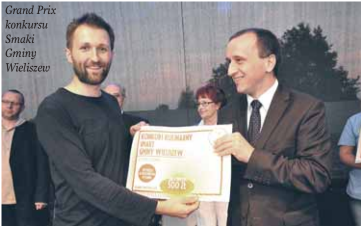
Grand Prix konkursu Smaki Gminy Wieliszew

Można powiedzieć, że każdy, kto podczas Dożynek Gminnych w Krubinie zaprezentował siebie i swoje talenty, otrzymał zasłużoną nagrodę. Zatem powodów do świętowania było wiele. Nic dziwnego, że podczas koncertu muzyki biesiadnej w wykonaniu Kamratów i coverowej zespołu G-Bang chętnych do tańca nie brakowało. Emocjonującym przerwaniem okazał się pokaz panowania nad ogniem, który uczestnikom imprezy zaprezentowała grupa kuglarzy Children of Fire.