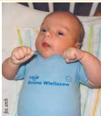
szewska uhonoruje również naszych milusińskich publikując ich zdjęcia na swoich łamach.

Wszyscy szczęśliwi „świeżo upieczeni” rodzice mogą osobiście zgłaszać się do Referatu Informacji i Promocji mieszczącego się w pokoju nr 9 Urzędu Gminy Wieliszew, telefonicznie pod numerem (022) 782 26 32 lub mailowo pisząc na adres promocja@wieliszew.pl w celu ustalenia daty wręczenia prezentu. Gazeta Wieliszewska