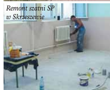
Remont szatni SP w Skrzeszewie