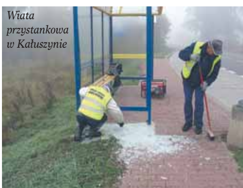
Wiata przystankowa w Kałuszynie