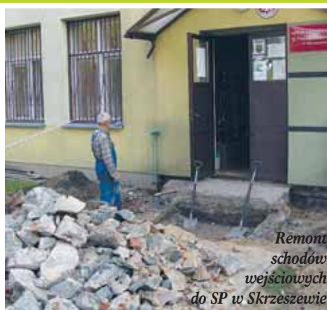
Remont schodów wejściowych do SP w Skrzeszewie

Przy OSP w Kałuszynie modernizowano odwodnienie. Budynek OSP usytuowany poniżej poziomu ul. Mickiewicza był zalewany przez wodę, spływającą grawitacyjnie w kierunku bramy.