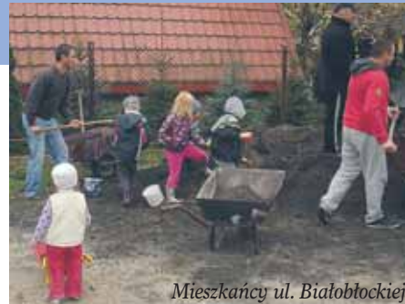
Mieszkańcy ul. Białobłockiej

Ponadto projektant kończy już prace nad przygotowaniem projektu zagospodarowania terenu działki gminnej na osiedlu 600-lecia w Wieliszewie. Projekt przewiduje wykonanie trawiastego boiska do piłki nożnej, boiska wielofunkcyjnego ze sztuczną nawierzchnią wraz z wyposażeniem.