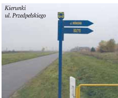
Kierunki ul. Przedpełskiego