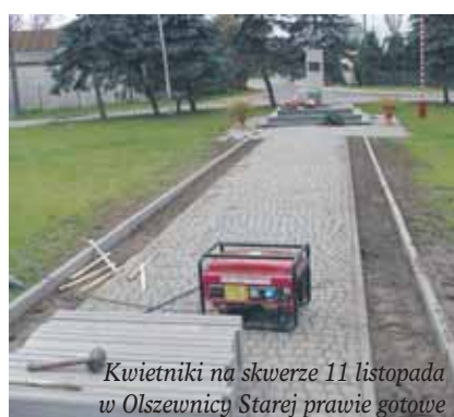
Kwietniki na skwerze 11 listopada w Olszewnicy Starej prawie gotowe