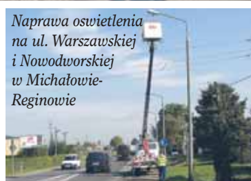
Naprawa oświetlenia na ul. Warszawskiej i Nowodworskiej i Michałowie-Reginowie