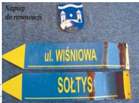
Napisy do renowacji

Wraz z końcem września zakończyły się problemy z oświetleniem w Michałowie-Reginowie. Uszkodzenia usunięto definitywnie 26 września. W tym samym czasie Gmina załatała dziury w ul. Granicznej, nieopodal Benckisera w Okuninie, a także wycięła zakrzaczenia wzdłuż ul. Rzecznej