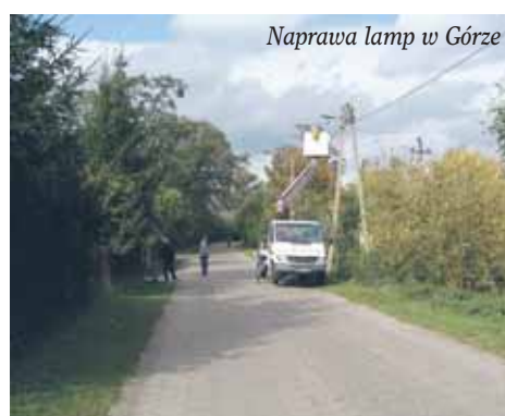
Naprawa lamp w Górze