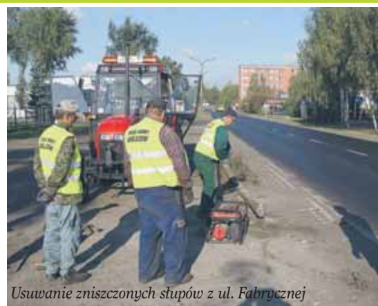
Usuwanie zniszczonych słupów z ul. Fabrycznej