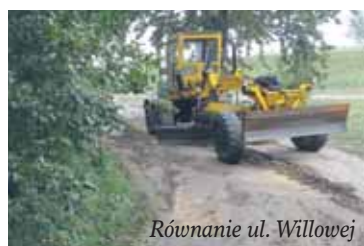
Równanie ul. Willowej