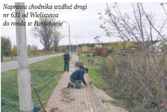
Naprawa chodnika wzdłuż drogi nr 631 od Wieliszewa do ronda w Poniatowie