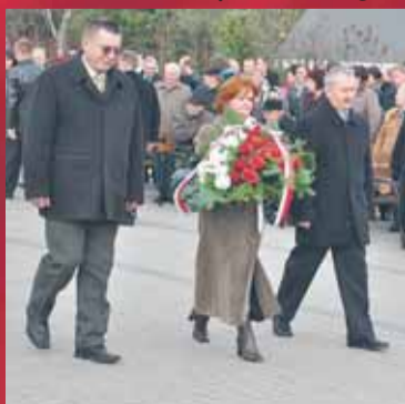
Wspólnota Gruntowa w Górze