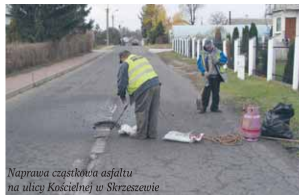
Naprawa cząstkowa asfaltu na ulicy Kościelnej w Skrzyszewie