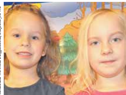
LEA I ZUZIA

Lewandowski jest dobrym Polakiem, bo bardzo go lubię, dobrze biega i strzela gole. Błaszczykowski jeszcze może być dobrym Polakiem, bo dobrze trafia w bramki. W domu jeszcze mój brat jest dobrym Polakiem, bo gra ze mną w piłkę.