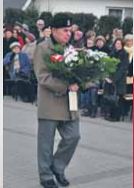
Mazowiecki Zarząd ZKiWP