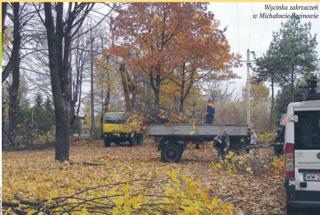
Wycinka zakrzaceń w Michałowie-Reginowie

Nie brakowało też drobnych remontów na drogach. Naprawiono chodnik wzdłuż drogi wojewódzkiej nr 631, na odcinku od ul. Przedpełskiego do ronda w Łajskach. Z końcem października rozpoczęto także malowanie dróg gminnych. Oznakowania poziome namalowano na ul. Przedpełskiego w Wieliszewie, ul. Szkolnej w Skrzyszewie, ulicach Solidarności i Modlińskiej w Wieliszewie. Kierownik Referatu Gospodarki