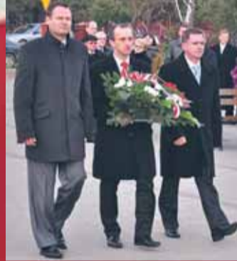
Władze samorządowe Gminy