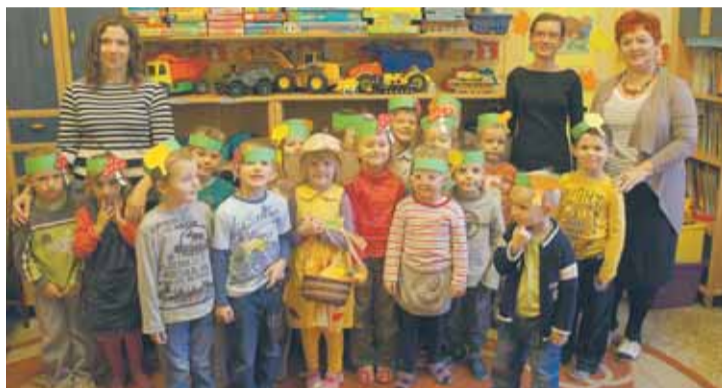
Przedszkole w Janówku 5-latki