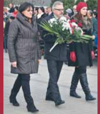
PiS oddział w Wieliszewie