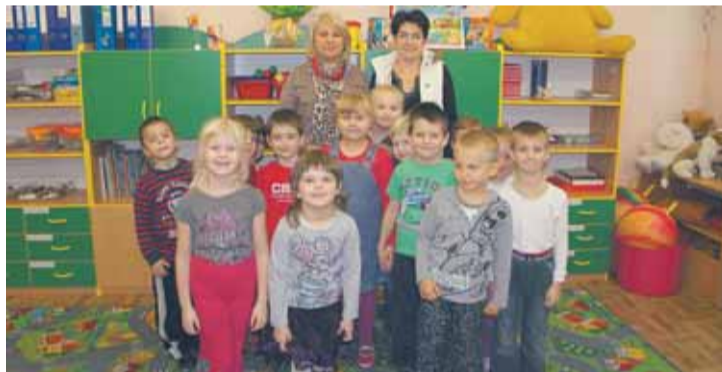
SP w Olszewnicy „zerówka”

w celu dokonania oceny dekoracji jesiennych przedszkoli i szkół, w tym ze szczególnym zwróceniem uwagi na bo-