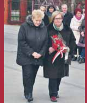
SEiR w Górze