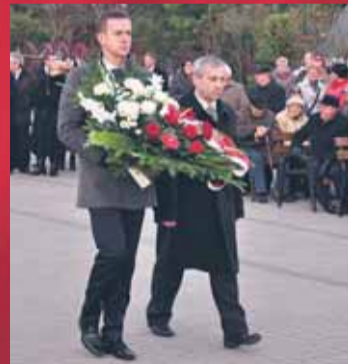
Samorząd Powiatu Legionowskiego