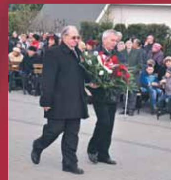
Towarzystwo Przyjaciół M-R