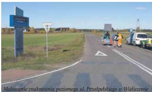
Malowanie znakowania poziomego ul. Przedpełskiego w Wieliszewie