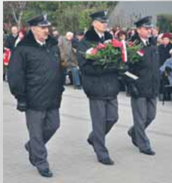
32. Dywizjon Raketowy OP