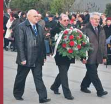
Olszewnica Nowa i Katuszyn