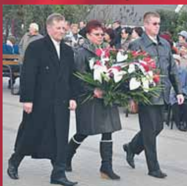
Wspólnota Wsi Janówek