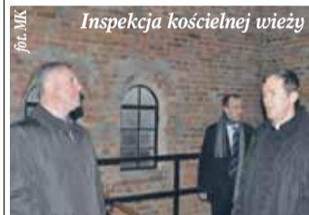
Inspekcja kościelnej wieży

Wspólnie naprawmy schody wieży kościelnej