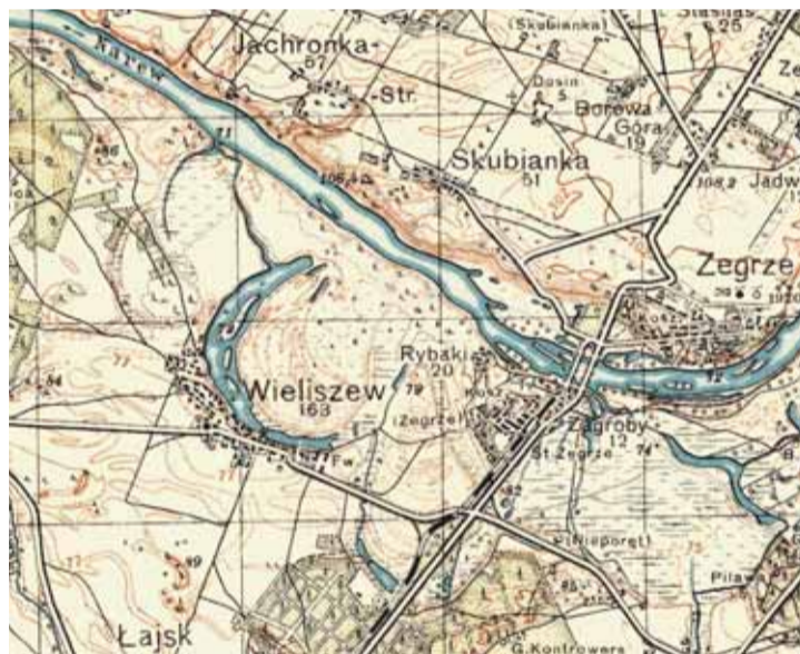
Jezioro Wieliszewskie na mapie z 1933 r.

69. rocznica Wybuchu Powstania Warszawskiego oraz 93. rocznica Bitwy Warszawskiej, jak co roku miały wyjątkową oprawę.