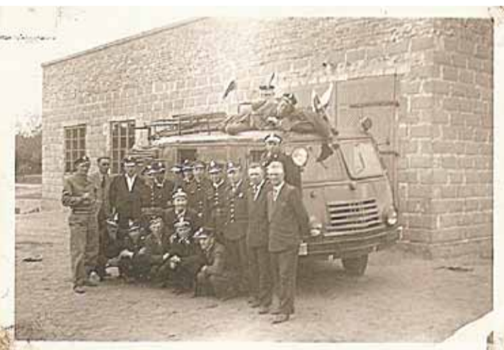
uzyskanie fot. arch. Straży

i opór mieszkańców w stosunku do ówczesnych władz.