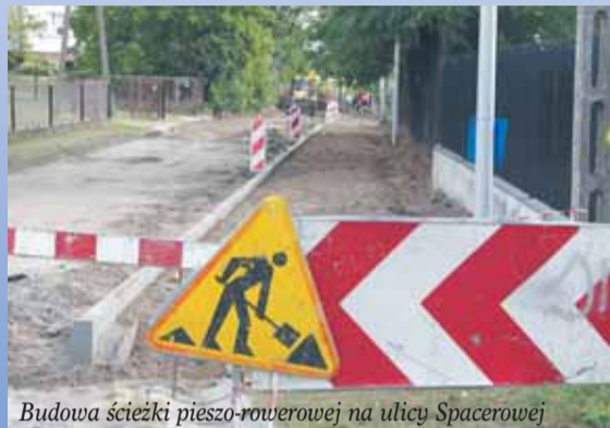
Budowa ścieżki pieszo-rowerowej na ulicy Spacerowej