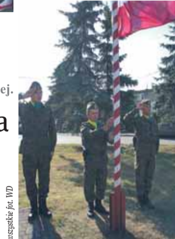
uzyskanie