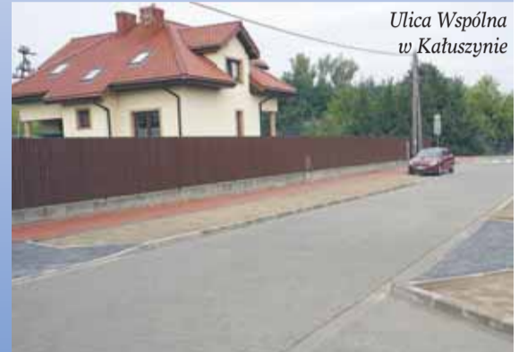
Ulica Wspólna w Kałuszynie