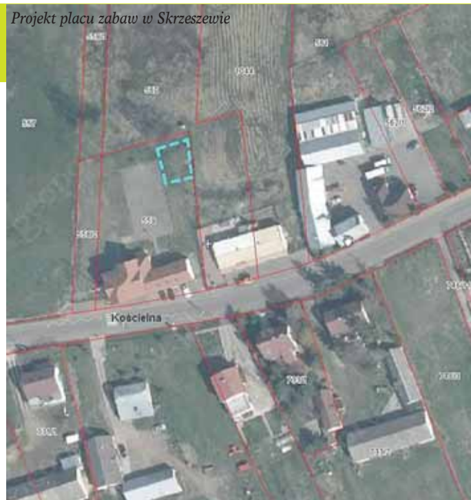
Projekt placu zabaw w Skrzeszewie

umiejscowiony przy wejściu na plac zabaw.