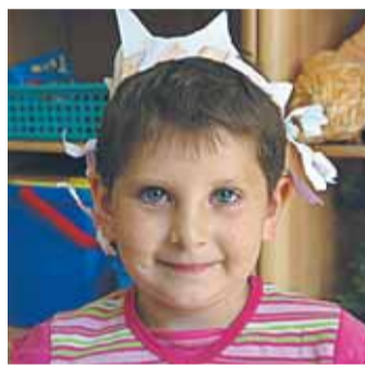
rozmawiała Magdalena Pietrzak

W tym numerze zapytaliśmy dzieci z Przedszkola Samorządowego w Janówku Pierwszym „JAKI JEST TWÓJ ULUBIONY PRZYSMAK W UPALNE DNI?”