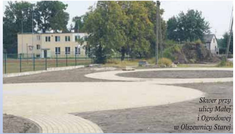
Skwer przy ulicy Małej i Ogrodowej w Olszewnicy Starej