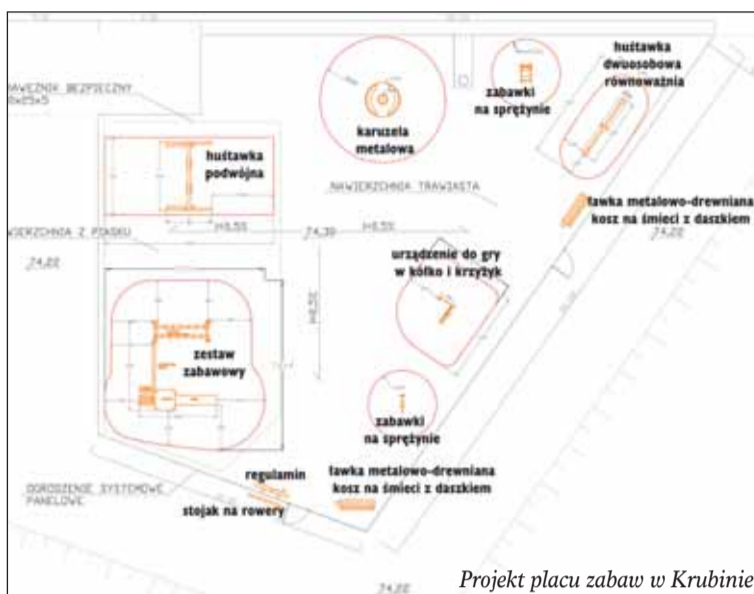
Projekt placu zabaw w Krubinie

Place zabaw to miejsca niezwykle istotne dla rozwoju motorycznego i socjalnego maluchów. Wiedzą o tym zarówno dorośli jak i dzieci. I warto aby takie działania wspierać i reklamować. Dzięki staraniom władz naszej Gminy oraz rozumieniu potrzeb najmłodszych już niebawem powstaną kolejne place zabaw. Do dotychczasowych miejsc rekreacji dla dzieci tj. w: Michałowie-Reginowie, Janówku, Olszewnicy Nowej, Olszewnicy Starej, Wieliszewie, Skrzeszewie, Kałuszynie dojdą nowe. Najmłodszy ze Skrzeszewa, Krubina, Komornicy oraz Łajsk już niedługo będą mogli spędzać czas na świeżym powietrzu korzystając z atrakcji jakie będzie im oferowało nowe miejsce do zabawy.