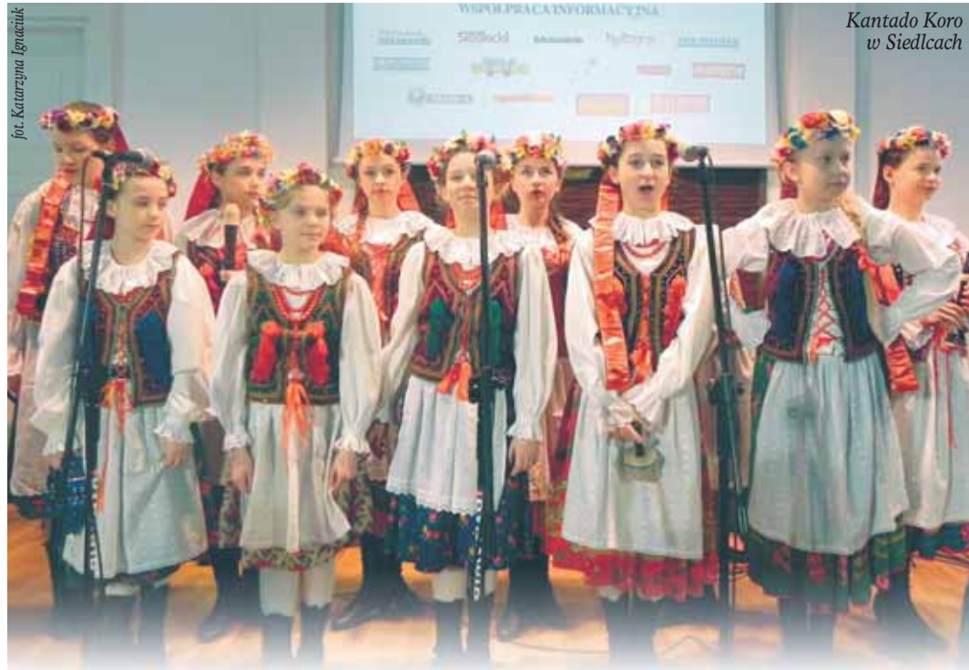
Kantado Koro w Siedlcach