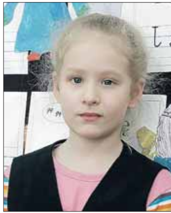
SANDRA lat 7

Nazwa wyspy pochodzi od tego, że w Wielkanoc jeden człowiek przyplłynął na tę wyspę i tak się ona teraz nazywa. Są na niej posągi, zgniła trawa. Nie ma żadnej wody, takich źródełek czystych, domów, drzew w ogóle nie ma, nie ma kokosów na drzewach, nie ma piachu. Wyspa znajduje się na wodzie. Posągi są bardzo wysokie i przedstawiają bogów - niektóre stoją a inne są poprzewalane. Prawdopodobnie walczyli ze sobą różni ludzie (jednych bogowie są w kapeluszach a innych nie) i podczas tych walk niektóre posągi zostały poprzewracane.