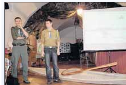
Prezentacja projektu harcerze

Niebagatelna kwota, której dysponentem w ramach projektu Partnerstwo w Widłach Trzech Rzek była Lokalna Organizacja Turystyczna Trzech Rzek przyczyniła się do realizacji niezwykle ciekawych projektów.