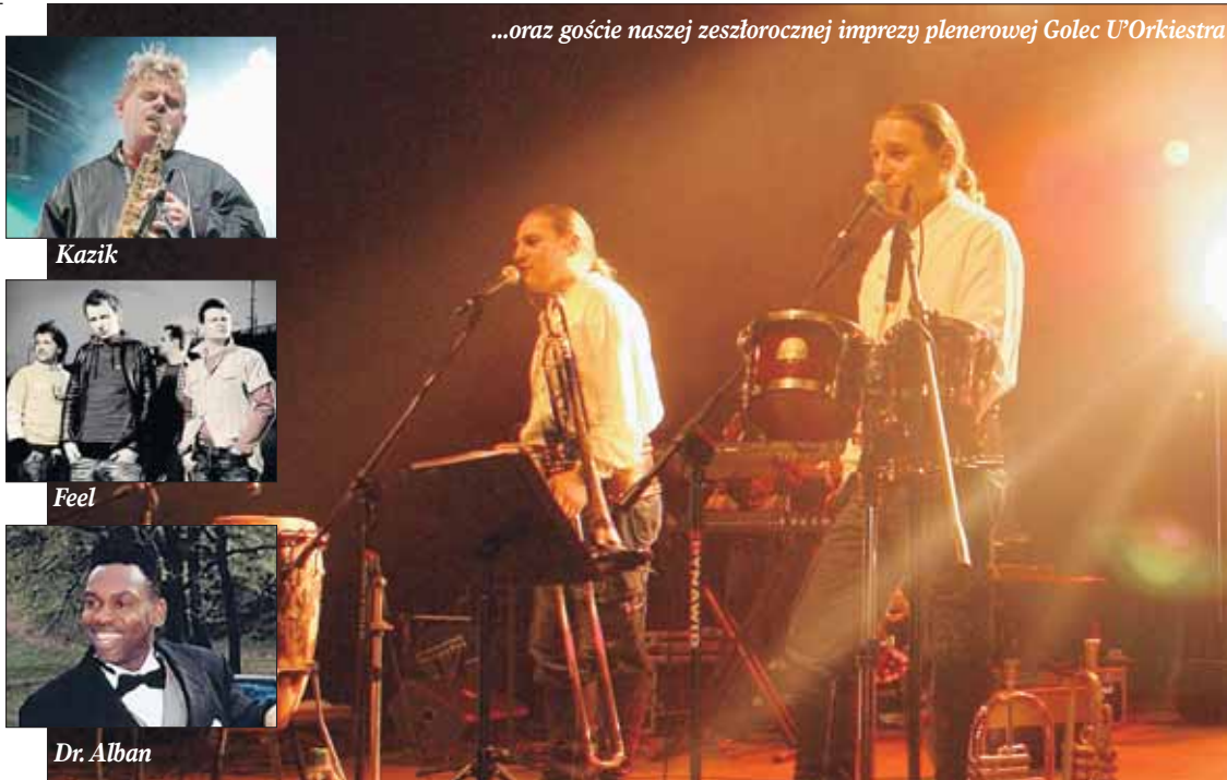
...oraz goście naszej zeszłorocznej imprezy plenerowej Golec U'Orkiestra

Gwiazdy imprez gminnych to rokrocznie element swego rodzaju rywalizacji pomiędzy samorządami. Która gmina ściągnie do siebie bardziej nośne nazwisko, której impreza na dłużej pozostanie w pamięci gości. Gości, którzy oczywiście pobiją lokalny rekord frekwencji.