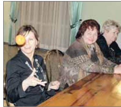
Jedno z zajęć warsztatowych

Nigdy jeszcze warsztaty ożywienia gospodarczego nie przyciągnęły tak dużej liczby uczestników. Na nasze zaproszenie do restauracji „Bar Leśny” w Skrzyszewie, w czwartkowe popołudnie, 7 lutego 2008 r., przybyli licznie przedstawiciele samorządu, organizacji pozarządowych oraz przedstawiciele działających na terenie gminy Wieliszew firm, łącznie ponad dwadzieścia osób. Mimo niema-