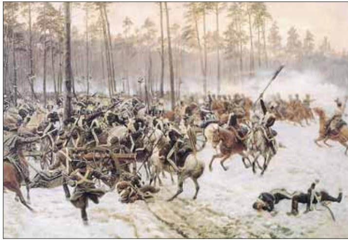
Bitwa o Stoczek