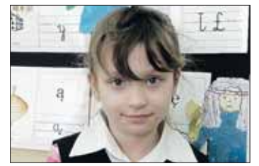
WIKTORIA lat 7

Wyspa Wielkanocna tak się nazywa, bo kiedyś pewien człowiek przyplłynął tam w święta i tak się teraz nazywa. Wybuchł tam kiedyś wulkan i powstały takie kamienie.