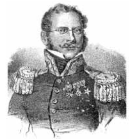
Ryc. Generał Ludwik Kicki (12.09.1791–26.05.1831)