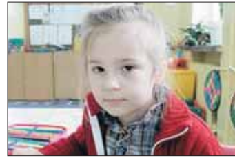
KINGA lat 6

Nazwę wyspy wymyślili ludzie, bo jak była Wielkanoc, to pewien pan ją odkrył. Znajdują się na niej olbrzymi z kamieni. Są one bez nóg i rąk, tylko samo ciało i głowa. Zrobili je ludzie albo kosmici. Ta wyspa jest na oceanie.