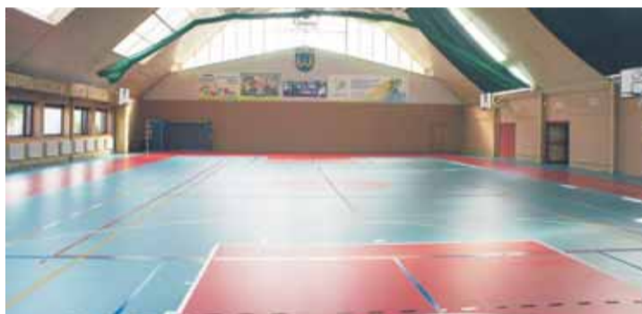
Hala Sportowa w Wieliszewie