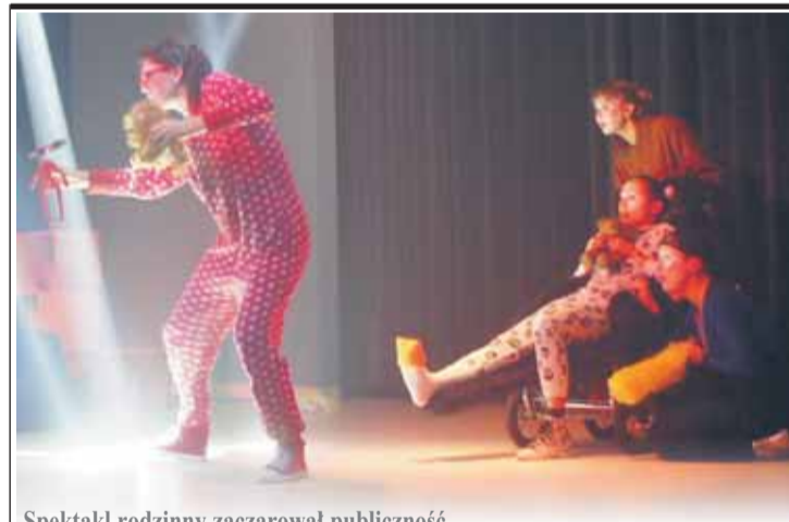
Spektakl rodzinny zaszarował publiczność.