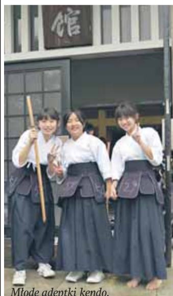
Młode adeptki kendo,