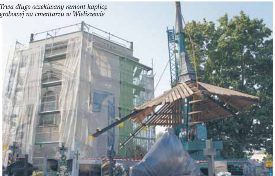
Trwa długo oczekiwany remont kaplicy grobowej na cmentarzu w Wieliszewie