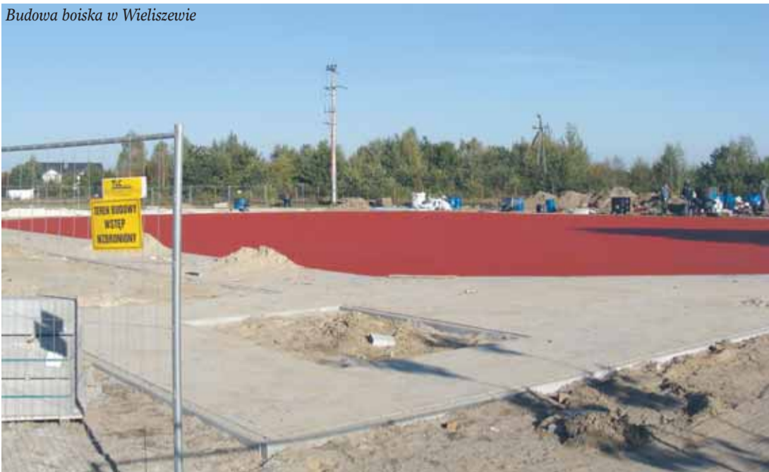
Budowa boiska w Wieliszewie

W ramach poprawy bezpieczeństwa komunikacyjnego i płynności ruchu w Gminie Wieliszew zostanie wykonana przebudowa i utwardzenie nawierzchni oraz oznakowanie na 11 odcinkach dróg gminnych. Aktualnie trwają prace w Olszewnicy Starej na ul. Polnej i Leśnej w Wieliszewie na ul. Jeziornej i Modlińskiej-Bis, Kościelnej na osiedlu Dębowa w Łąjskach oraz na ul. Akacyjnej w Michałowie-Reginowie. W następnej kolejności rozpoczną się prace w Łąjskach na ul. Bukowej i odcinku ul. Białobłockiej. Pozostałe odcinki dróg przewidzianych do utwardzenia to: ul. Łąkowa i Agronomówka w Janówku Pierwszym, ul. Łabędziowa w Krubinie, ul. Akacyjna w Michałowie-Reginowie. Wykonawcą jest firma BUDOMOST Sp. z o.o. Wartość inwestycji to 1 032 969,24 zł. Wszystkie prace mają zostać zakończone do końca października.