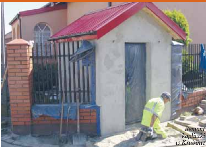
Remont kapliczki w Krubinie