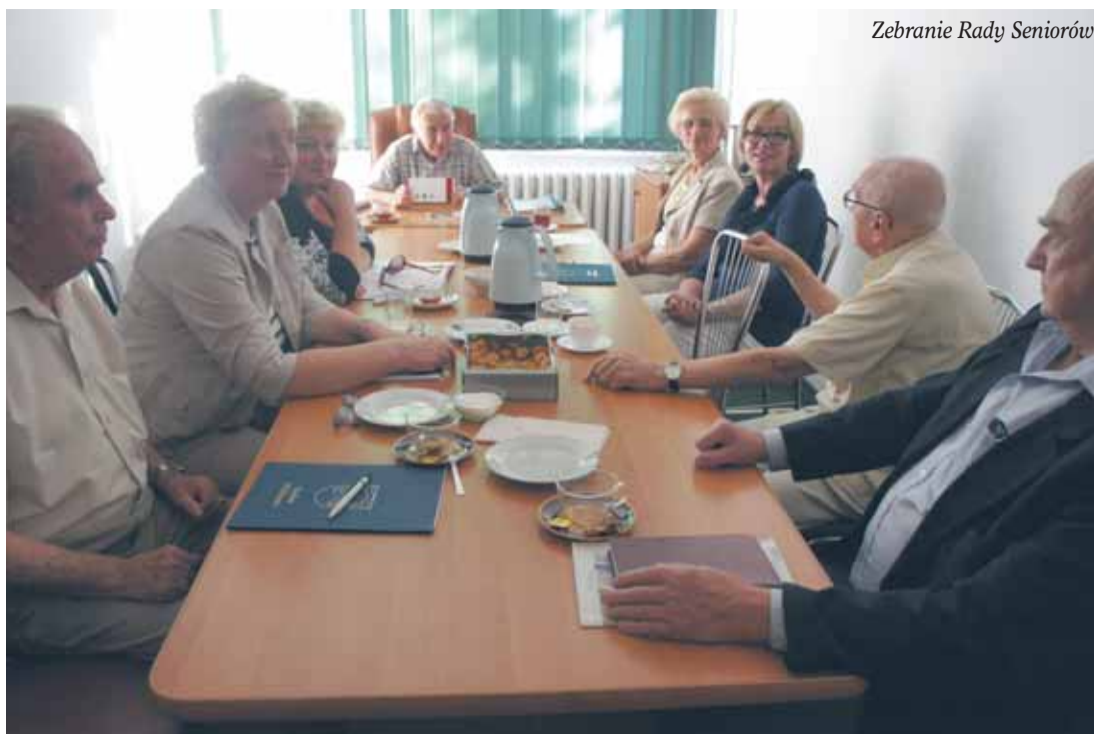
Zebranie Rady Seniorów