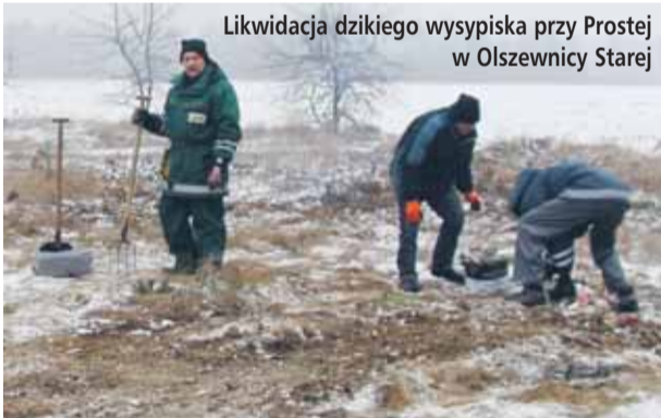
Likwidacja dzikiego wysypiska przy Prostej w Olszewnicy Starej