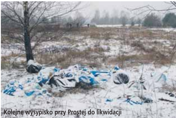
Kolejne wysypisko przy Prostej do likwidacji