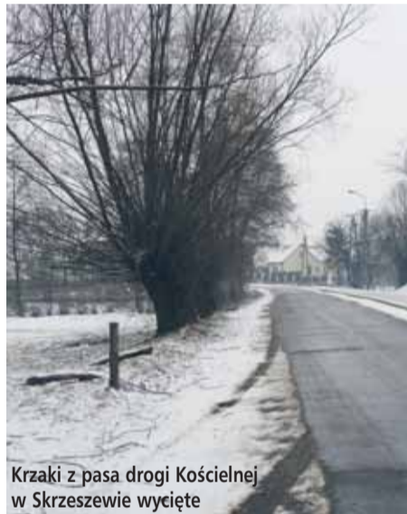
Krzaki z pasa drogi Kościelnej w Skrzeszewie wycięte