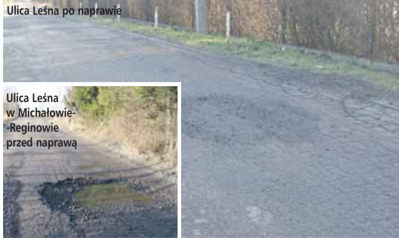
Ulica Leśna po naprawie

Zima zawitała do Gminy Wieliszew tylko na chwilę, ale m.in. w wyniku przymrozków, na drogach pojawiły się dziury, które są sukcesywnie usuwane. Pracownicy GKO likwidują też dzikie wysypiska oraz usuwają utrudniające ruch krzewy.