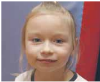
ADA, 5 LAT

Talent to jest to, co uwielbiasz robić i co robisz. Ja się uwielbiam bawić i oglądać telewizję. Talent to jeszcze oglądanie gwiazd przez teleskop. I robić dekoracje i jeszcze choinkę. Do Mikołaja też trzeba mieć talent. Ja mam talent do Mikołaja.