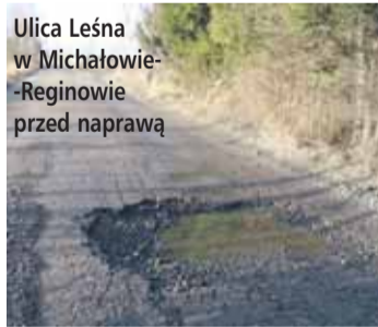
Ulica Leśna w Michałowie-Reginowie przed naprawą