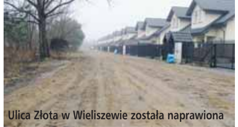
Ulica Żłota w Wieliszewie została naprawiona