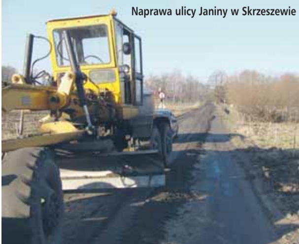
Naprawa ulicy Janiny w Skrzeszewie