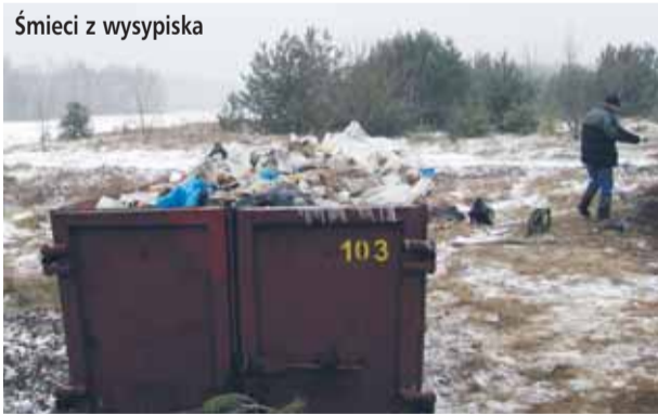
Śmieci z wysypiska