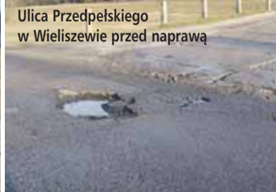
Ulica Przedpełskiego w Wieliszewie przed naprawą