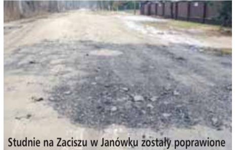
Studnie na Zaciszu w Janówku zostały poprawione