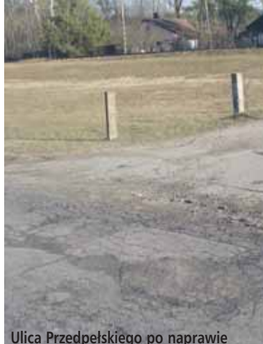
Ulica Przedpełskiego po naprawie