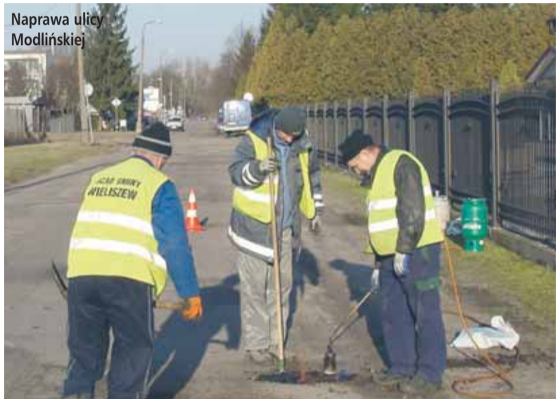
Naprawa ulicy Modlińskiej

Zima zawitała do Gminy Wieliszew tylko na chwilę, ale m.in. w wyniku przymrozków, na drogach pojawiły się dziury, które są sukcesywnie usuwane. Pracownicy GKO likwidują też dzikie wysypiska oraz usuwają utrudniające ruch krzewy.