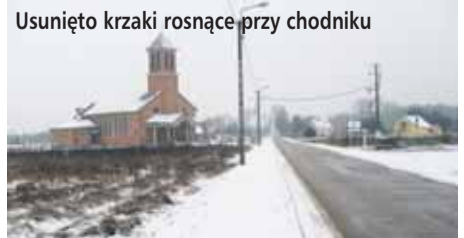
Usunięto krzaki rosnące przy chodniku