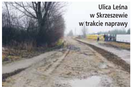
Ulica Leśna w Skrzeszewie w trakcie naprawy