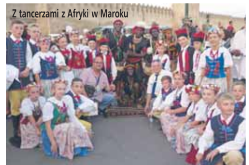
Z tancerzami z Afryki w Maroku

Dla Zespołu Tańca Ludowego „Promyki” wakacje nie oznaczają bynajmniej leżenia do góry brzuchem (choć oczywiście i takich okazji nie brakuje) – kulturalna wizytówka Gminy Wieliszew (i ambasador polskiej kultury) tradycyjnie bierze udział w letnich, międzynarodowych festiwalach folklorystycznych. W tym roku wybór padł na egzotyczne Maroko (po raz pierwszy) i (po raz trzeci) orientalne Indie.