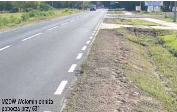
MZDW Wołomin obniża pobocza przy 631