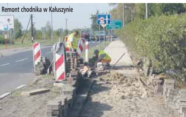
Remont chodnika w Kaluszynie