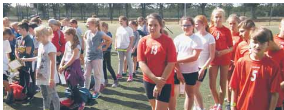
W Skrzeszewie, w dniach 9–10 września rozegrano gminne eliminacje VI Turnieju o Puchar Premiera RP.