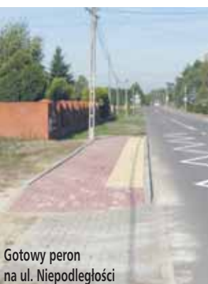
Gotowy peron na ul. Niepodległości