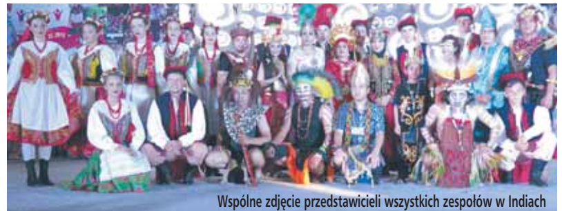
Wspólne zdjęcie przedstawicieli wszystkich zespołów w Indiach