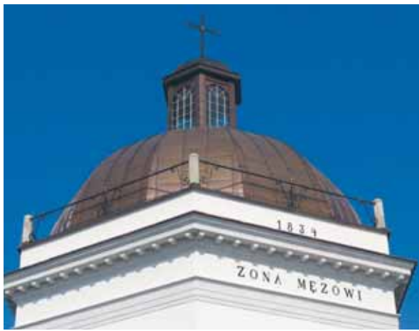
Kaplica przed remontem