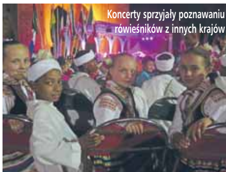
Koncerty sprzyjały poznawaniu rówieśników z innych krajów