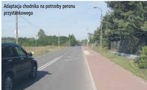
Adaptacja chodnika na potrzeby peronu przystankowego