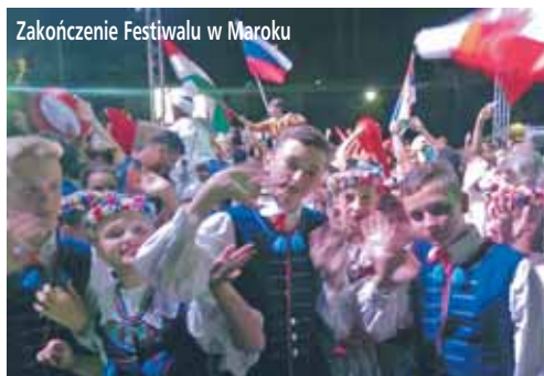
Zakończenie Festiwalu w Maroku