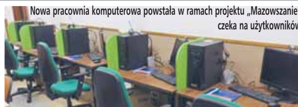
Nowa pracownia komputerowa powstała w ramach projektu „Mazowszanie” czeka na użytkowników