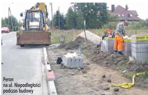
Peron na ul. Niepodległości podczas budowy