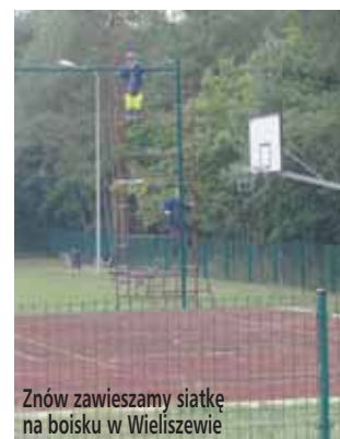
Znów zawieszamy siatkę na boisku w Wieliszewie