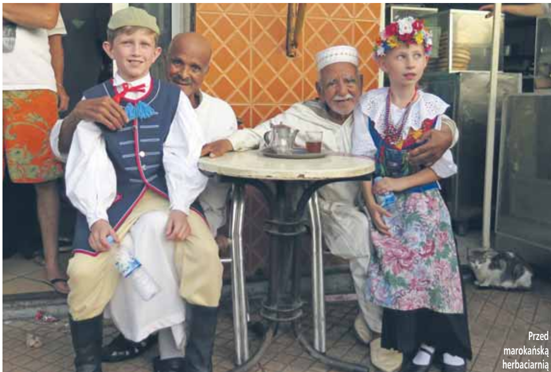
Przed marokańską herbaciarnią