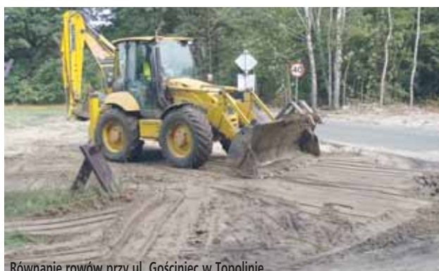
Równanie rowów przy ul. Gościniec w Topolinie