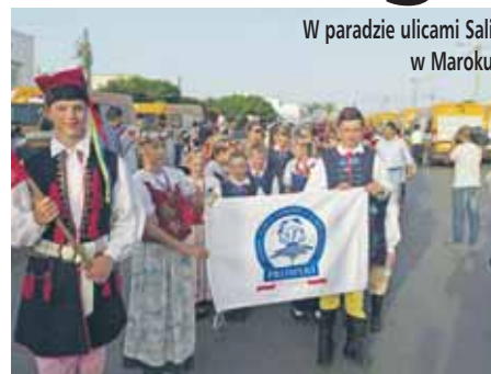
W paradzie ulicami Sali w Maroku