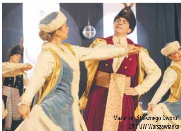
Mazur ze „Strasznego Dworu” ZPiT UW Warszawianka