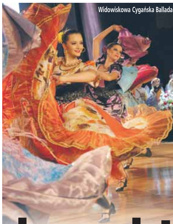
Widowiskowa Cygańska Ballada