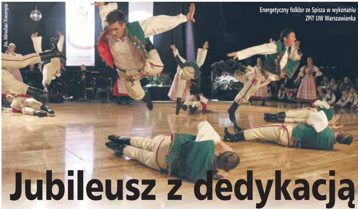
Energetyczny folklor ze Spisza w wykonaniu ZPiT UW Warszawianka