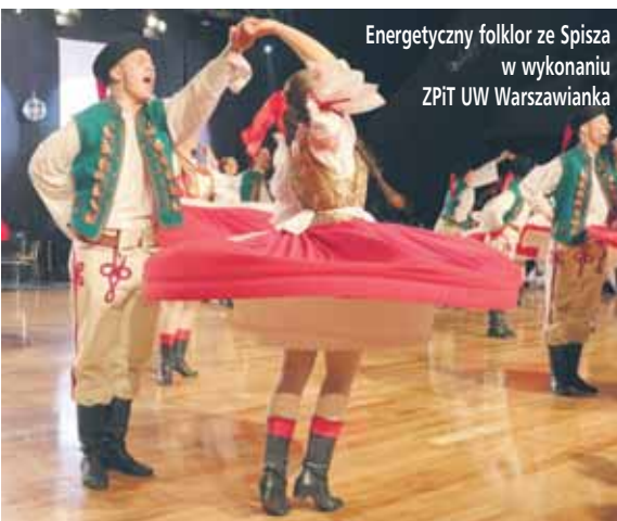
Energetyczny folklor ze Spisza w wykonaniu ZPiT UW Warszawianka