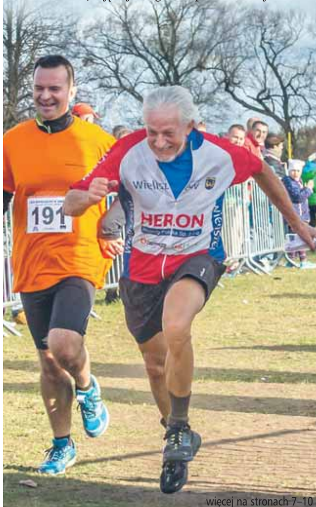
więcej na stronach 7-10