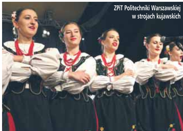
ZPiT Politechniki Warszawskiej w strojach kujawskich