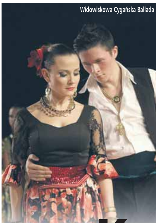
Widowiskowa Cygańska Ballada