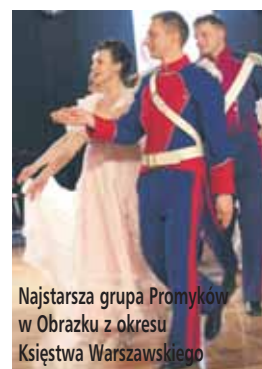
Najstarsza grupa Promyków w Obrazku z okresu Księstwa Warszawskiego