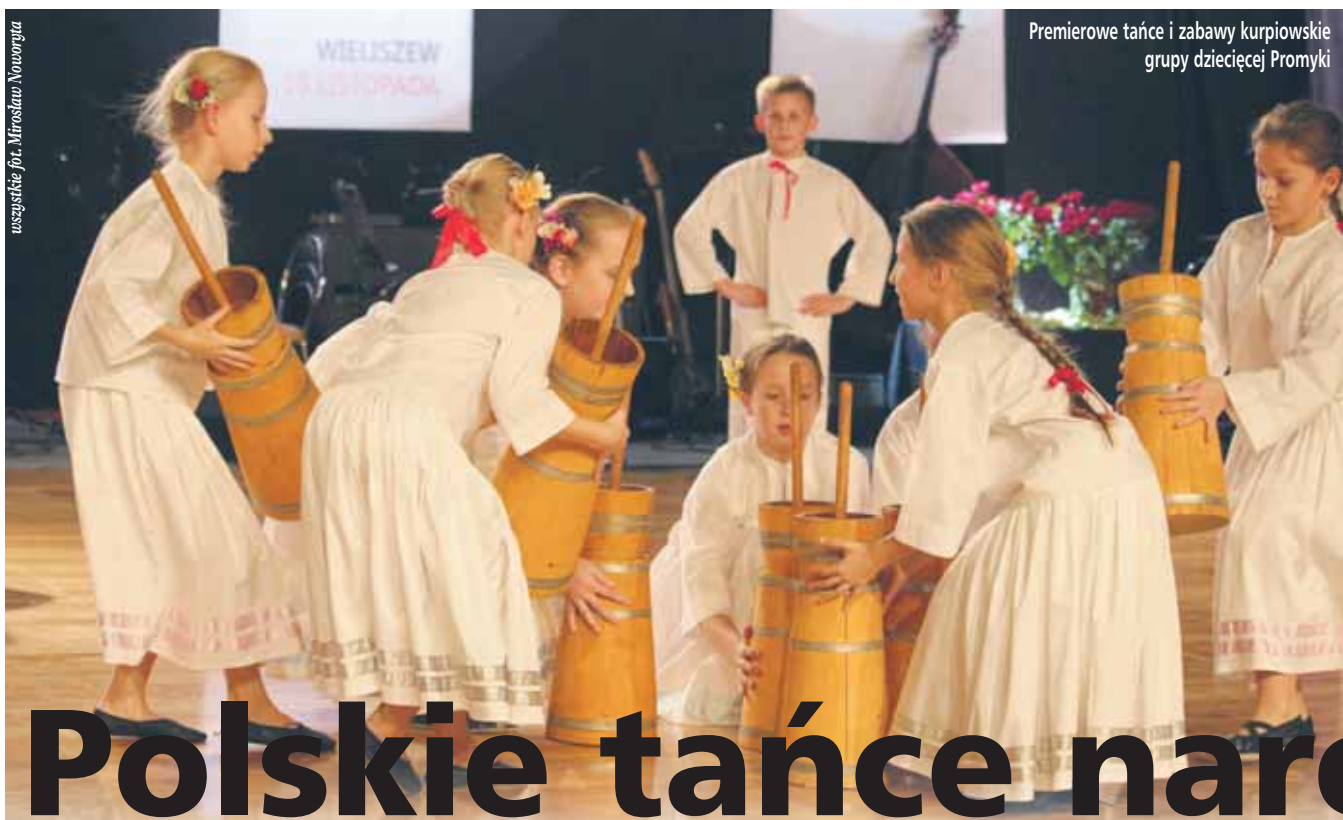
Premierowe tańce i zabawy kurpiowskie grupy dziecięcej Promyki