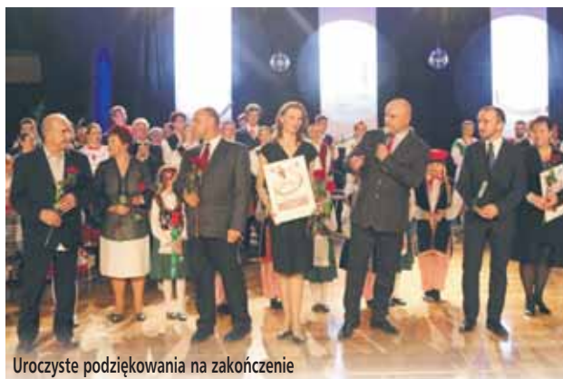
Uroczyste podziękowania na zakończenie