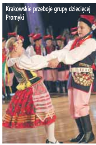
Krakowskie przeboje grupy dziecięcej Promyki