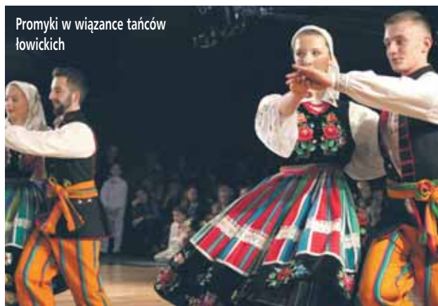
Promyki w wiażance tańców łowickich