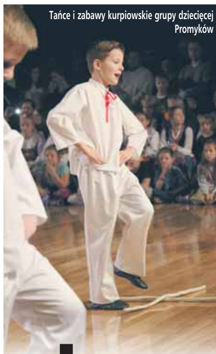
Tańce i zabawy kurpiowskie grupy dziecięcej Promyków