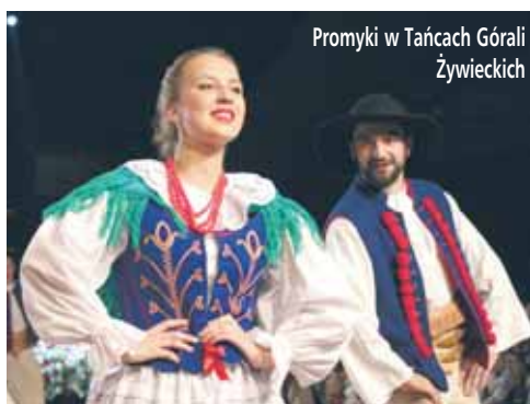
Promyki w Tańcach Górali Żywieckich