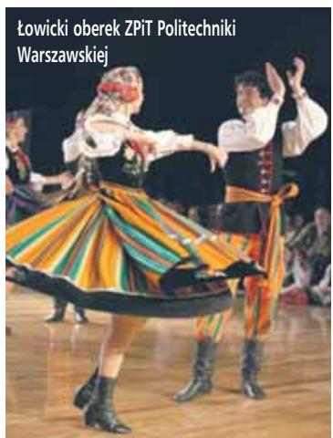
Łowicki oberek ZPiT Politechniki Warszawskiej