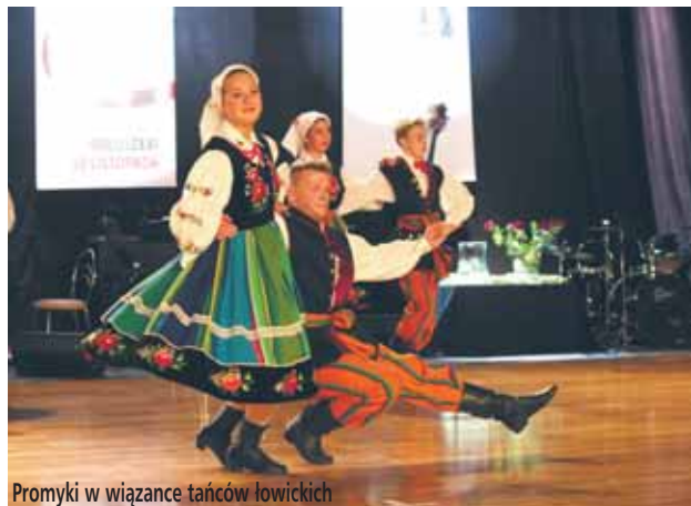
Promyki w wiażance tańców łowickich