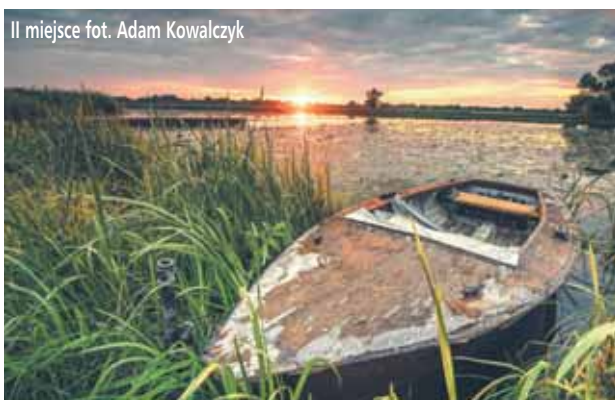
II miejsce