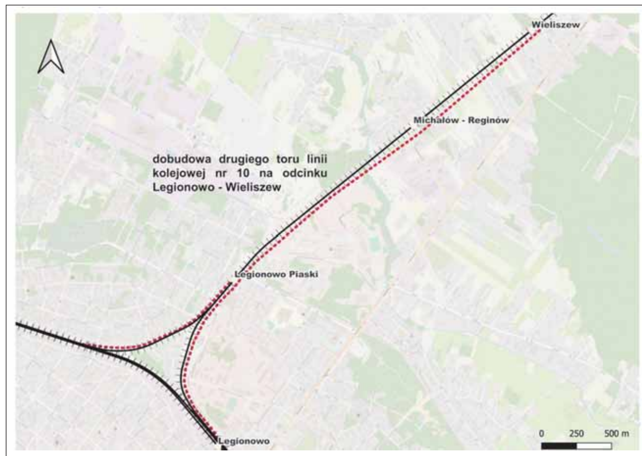
Rozbudowa linii nr 10