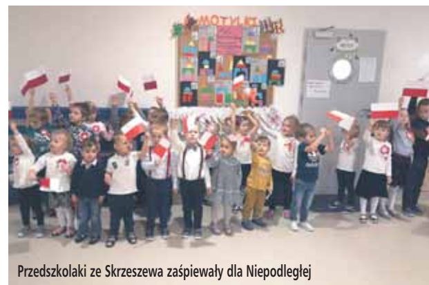
Przedszkolaki ze Skrzeszewa zaśpiewali dla Niepodległej