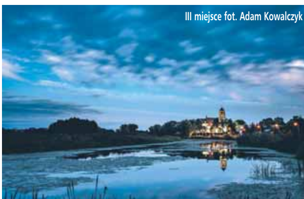
III miejsce