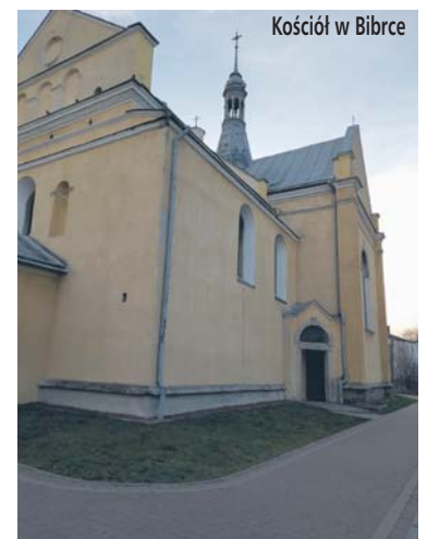
Kościół w Bibrce