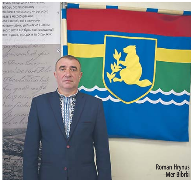
Roman Hrynus Mer Bibrki

Gminy podpisały umowę na zasadach przyjaźni i szeroko rozumianej współpracy. Dzięki niej gminy będą się wzajemnie wspierać, podejmować i koordynować wspólne działania. Przybliżamy Państwu informacje o tym wyjątkowym miejscu, z którym Gmina Wieliszew będzie realizować wiele wspólnych projektów edukacyjnych, samorządowych, gospodarczych, społecznych i humanitarnych.