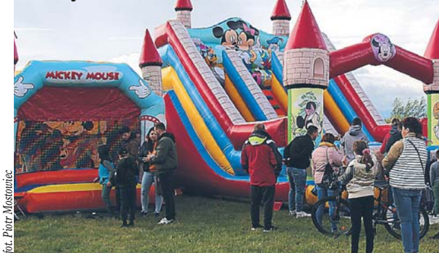
Pomoc sołectw przy imprezach gminnych