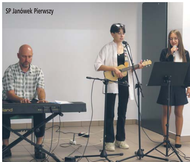
SP Janówek Pierwszy

Koszt inwestycji powiększenia szkoły to 16,5 mln złotych. W ich skład będą wchodziły między innymi: budowa dwupiętrowego skrzydła, przeznaczonego na przedszkole i zaplecze kuchenne na parterze oraz szkołę podstawową na piętrze. W ramach umowy zostanie również wyremontowany istniejący budynek i zrobiona termoizolacja. Jeśli wszystko pójdzie zgodnie z planem, to za dwa lata podstawówka w Olszewnicy Starej zyska kilkanaście dodatkowych klas, które będą mogły przyjąć dzieci.