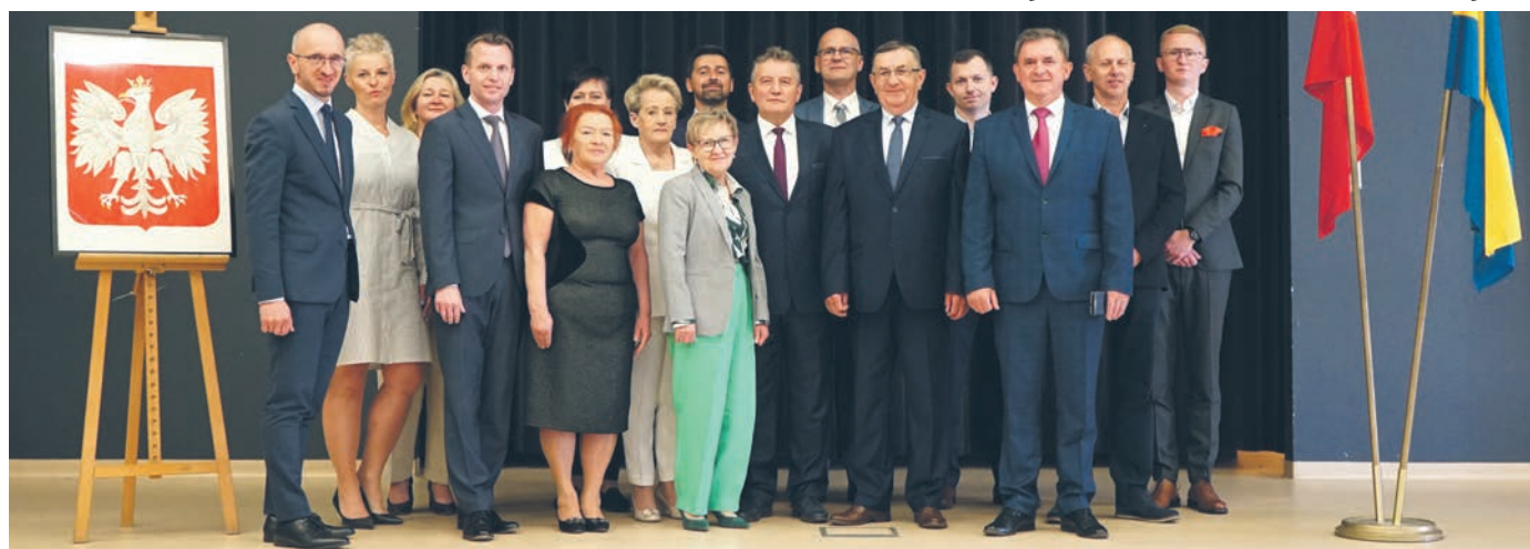
SKŁADY KOMISJI RADY GMINY WIELISZEW IX KADENCJI