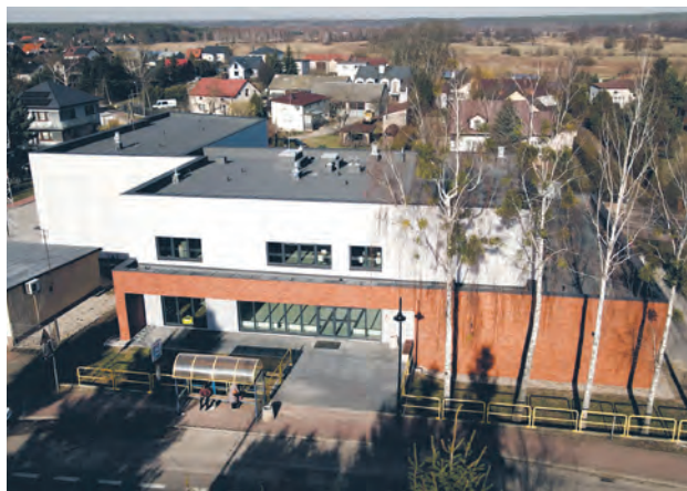
Budynek Centrum Społeczno-Kulturalnego w Wieliszewie

Zdobywanie wiedzy, rozwijanie pasji, poznawanie ciekawych ludzi, rozwój sportowy, budowanie kreatywności zarówno u młodszych jak i starszych, do tego integrowanie i obcowanie z kulturą. To tylko niektóre z funkcji jakie pełni Centrum Społeczno-Kulturalne w Wieliszewie.