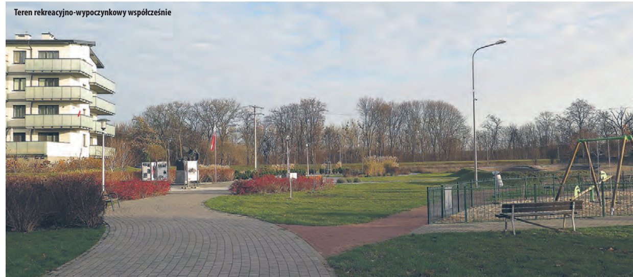
Teren rekreacyjno-wypoczynkowy współcześnie