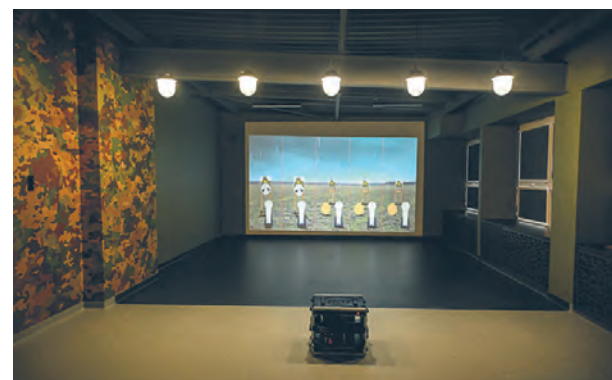
Wizualizacja strzelnicy

Strzelnica w Komornicy jest pierwszą tego typu jednostką w Powiecie Legionowskim. Jej powstanie to efekt udziału Gminy Wieliszew w konkursie „Strzelnica w powiecie 2024”, ogłoszonego przez Ministerstwo Obrony Narodowej. Całociągowa kwota inwestycji to 119 000 złotych, a uzyskana dotacja z MON-u to 89 250 000 złotych. Koszt remontu i przystosowania sali na strzelnicę poniosła gmina i szkoła w Komornicy.