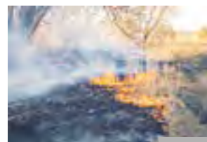
Dlaczego nie wolno wypalać traw