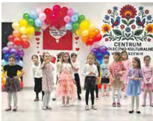
27 lutego w CSK w Wieliszewie dzieci z zerówki SP1 w Wieliszewie wystąpiły dla Babć i Dziadków