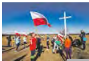
Wieliszewski bieg Tropem Wilczym