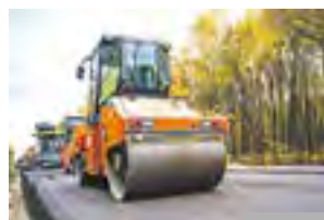
Gminne inwestycje drogowe