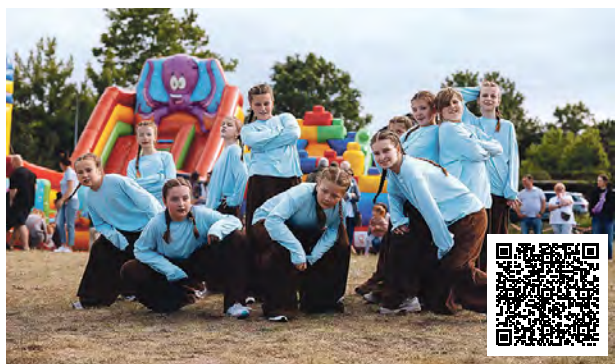
Więcej zdjęć gdy zeskanujesz QR kod